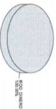
Distribución del Patrimonio