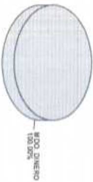
Distribución del Patrimonio