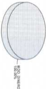
Distribución del Patrimonio