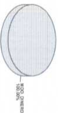
Distribución del Patrimonio