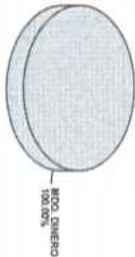
Distribución del Patrimonio