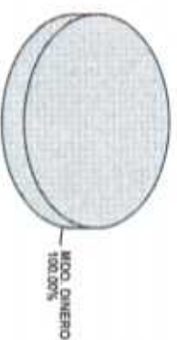
Distribución del Patrimonio