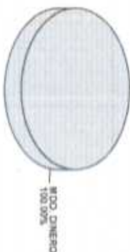
Distribución del Patrimonio