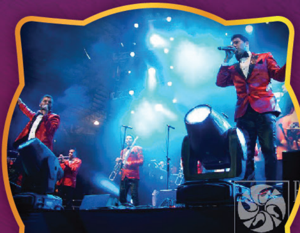
LA INOLVIDABLE BANDA AGUA DE LA LLAVE