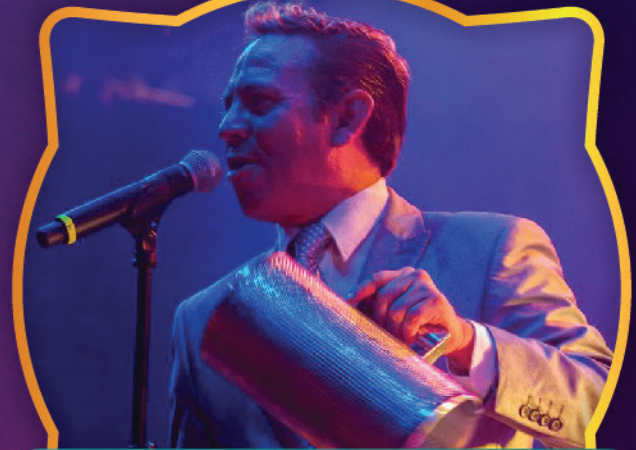
SONORA PACHANGUERA, MERMELADA, PALOMAR Y DINAMITA