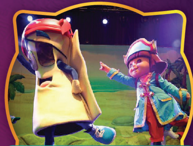
DORA LA EXPLORADORA