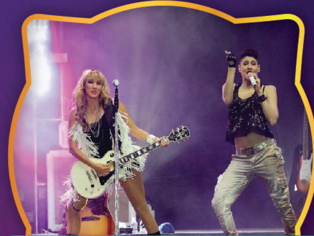
HA - ASH