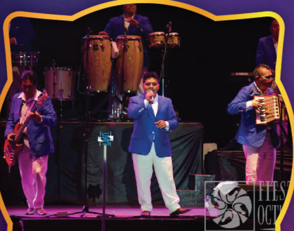
LOS ÁNGELES AZULES