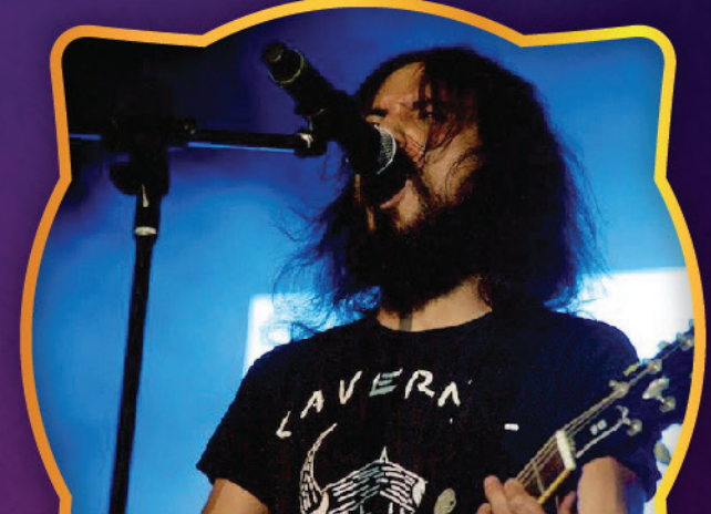
DISIDENTE, GRAND MAMA, QUINTA KALAVERA Y FULLER & WENZ