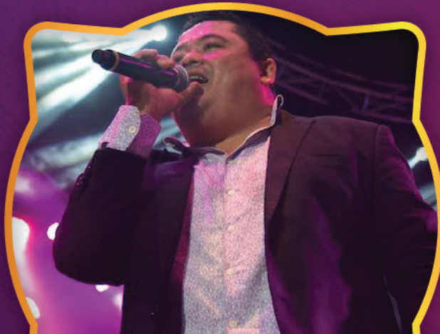
EVENTO LA MEJOR