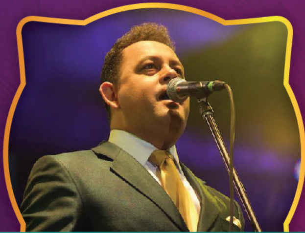
SONORA SANTANERA, KALIENTE, VAINILLA Y ZONA KUMBIA