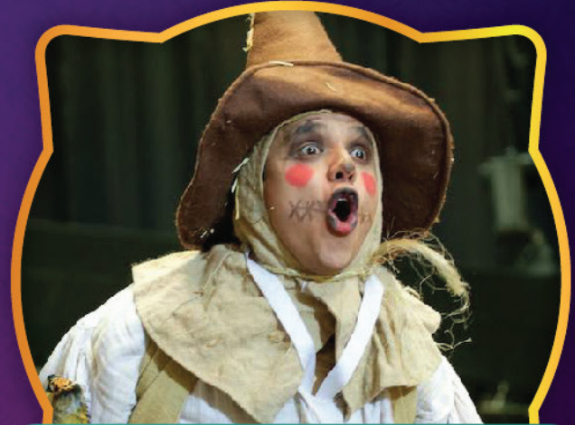
EL MARAVILLOSO MAGO DE OZ