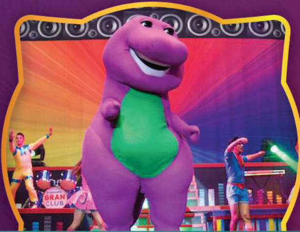
PEQUEÑO GRAN CLUB