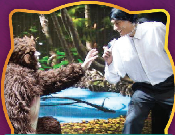
TARZÁN: EL REY DE LA SELVA