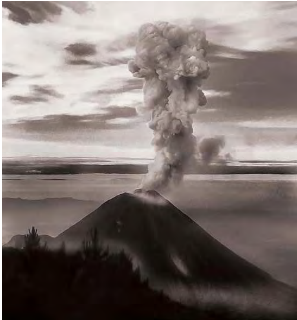
Figura 20.3. Exhalación de vapor, agua y ceniza de 1,000 metros de altura, del Volcán de Colima