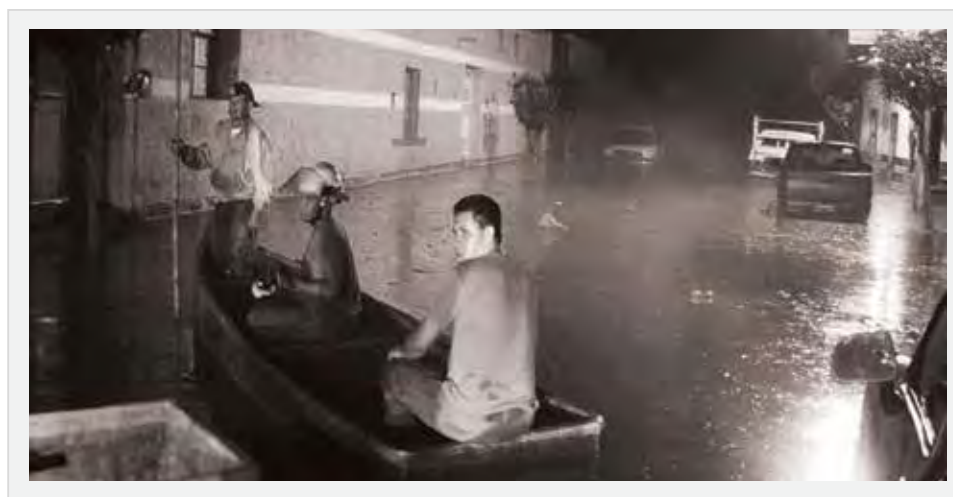
Figura 20.2. Inundación en el municipio de Teuchitlán, junio 2013