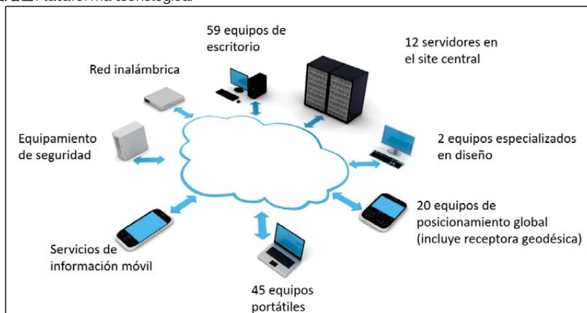
Figura 2. Plataforma tecnológica.