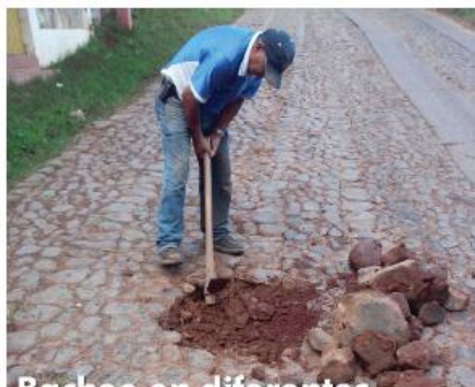
Bacheo en diferentes vialidades de la cabecera municipal de Mazamitla