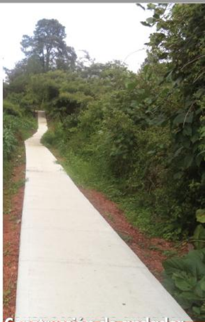
Construcción de andador en la localidad de La Central (La Central - El Terrero)