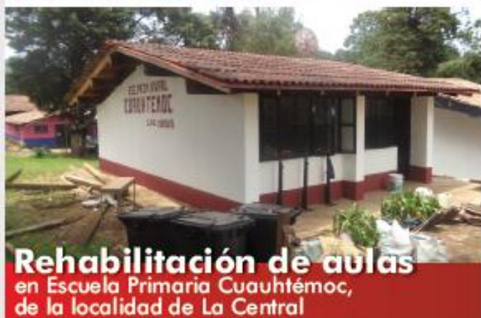
Rehabilitación de aulas en Escuela Primaria Cuauhtémoc, de la localidad de La Central