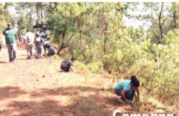
Campaña de reforestación

y para el tratamiento de las aguas residuales, se dio un mantenimiento exhaustivo a las plantas tratadoras de municipio, poniéndolas de nuevo en funcionamiento, con ello las aguas tratadas ahora son aprovechadas principalmente en la agricultura y la ganadería local.