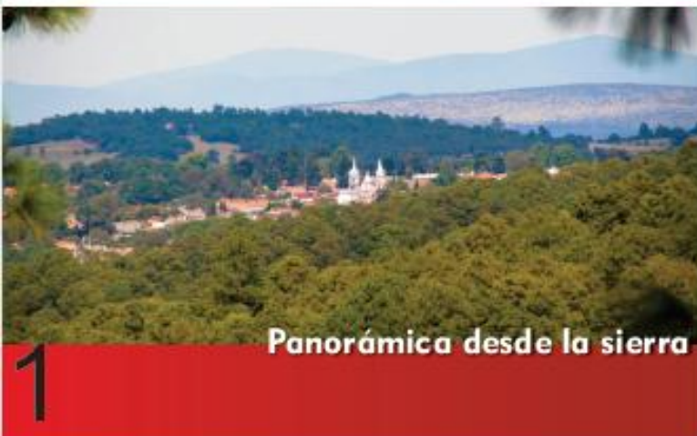
Panorámica desde la sierra