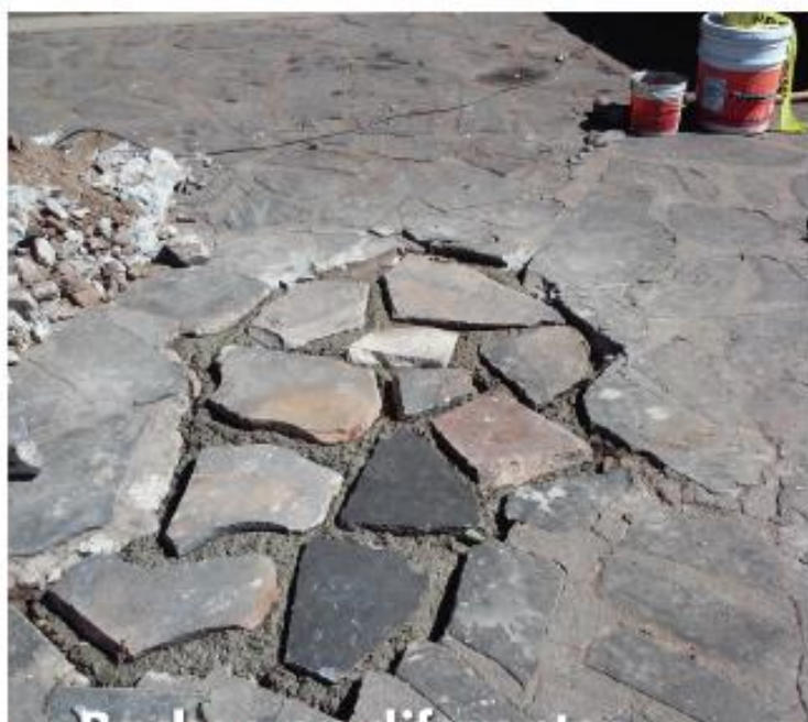
Bacheo en diferentes vialidades de la cabecera municipal de Mazamitla