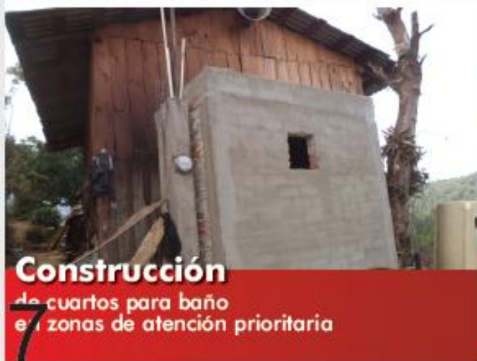
Construcción de cuartos para baño en zonas de atención prioritaria