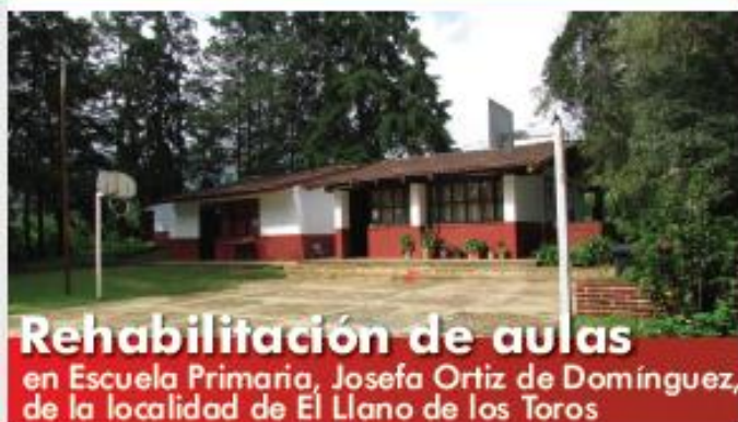
Rehabilitación de aulas en Escuela Primaria, Josefa Ortiz de Domínguez, de la localidad de El Llano de los Toros