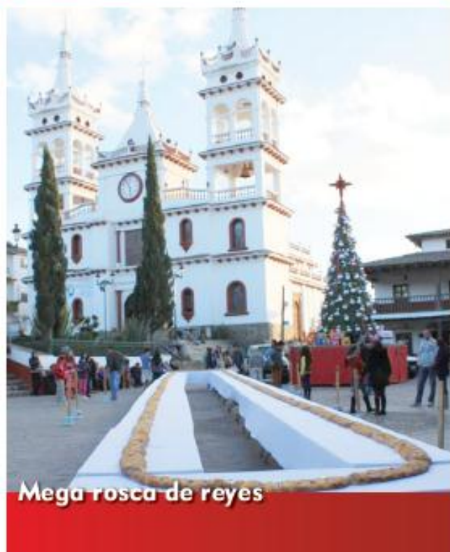
Mega rosca de reyes