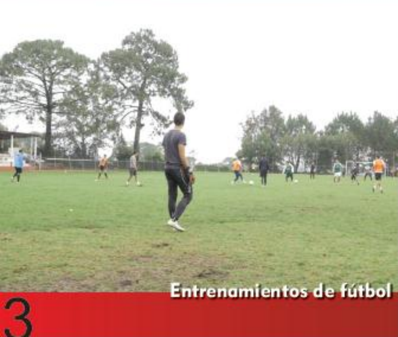
Entrenamientos de fútbol