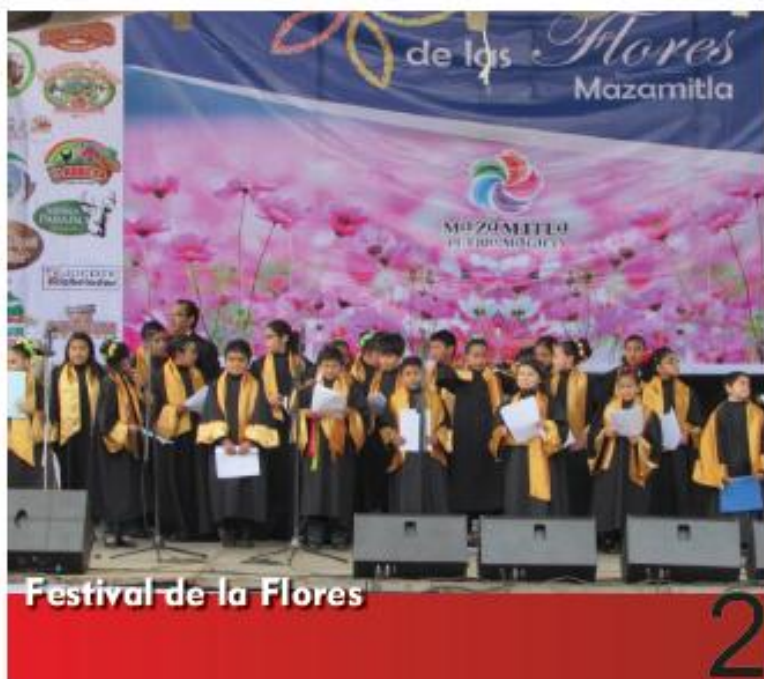
Festival de la Flores