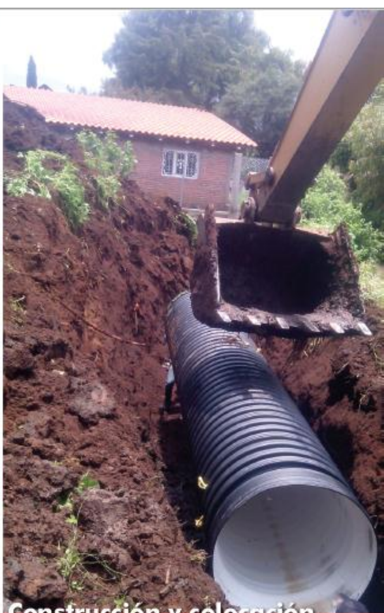
Construcción y colocación de tubería de polietileno de alta densidad de 36" para aguas residuales en la localidad de la Cofradía y el Paso de los Arrieros