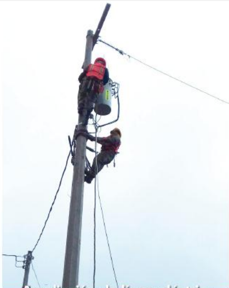
Ampliación de línea eléctrica de alta y baja tensión en las localidades, La Huevera y El Derramadero