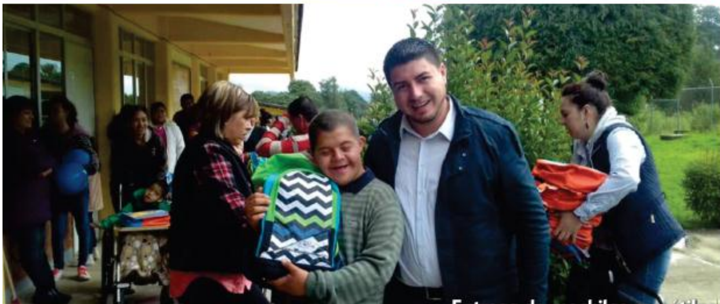
Entrega de mochilas con útiles