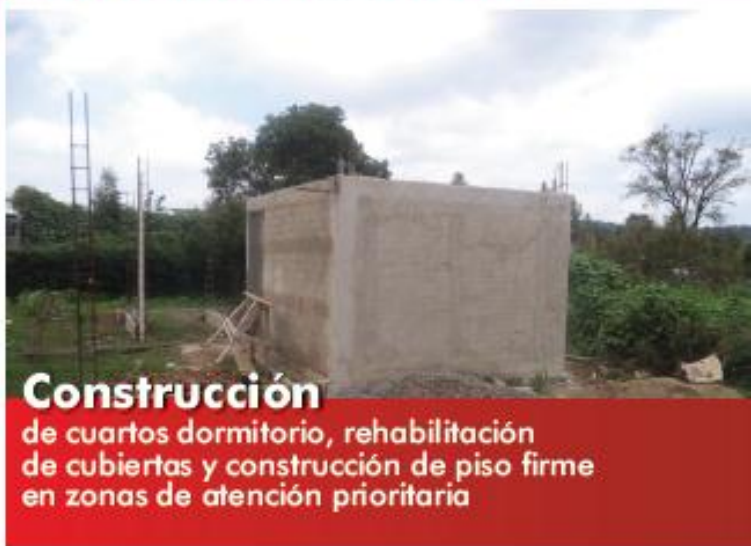
Construcción de cuartos dormitorio, rehabilitación de cubiertas y construcción de piso firme en zonas de atención prioritaria