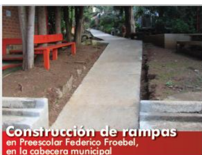
Construcción de rampas en Preescolar Federico Froebel, en la cabecera municipal