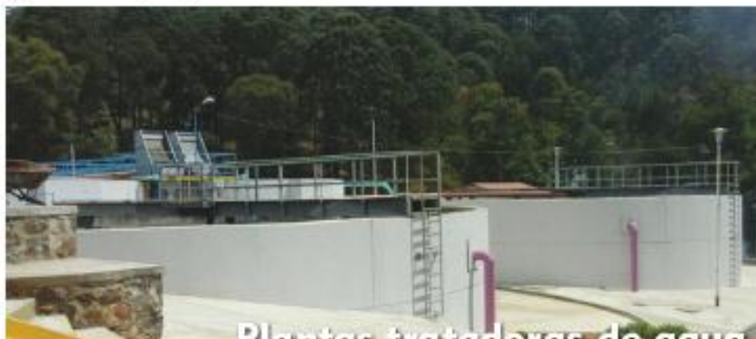
Plantas tratadoras de agua