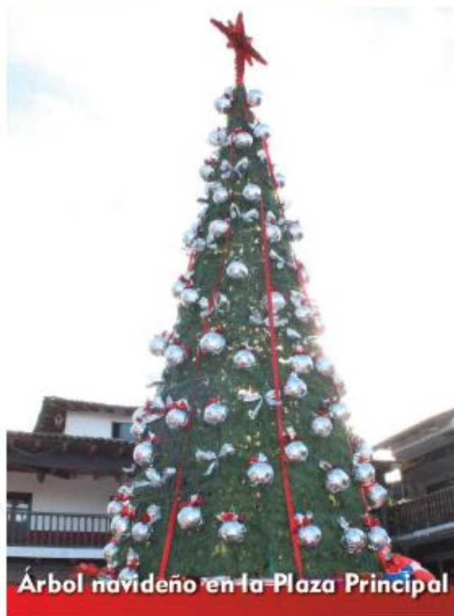
Árbol navideño en la Plaza Principal

Uno de los principales objetivos en esta administración es el de fomentar la Cultura; integrando a niños, jóvenes y adultos participando en actividades recreativas, educativas y artístico-culturales.