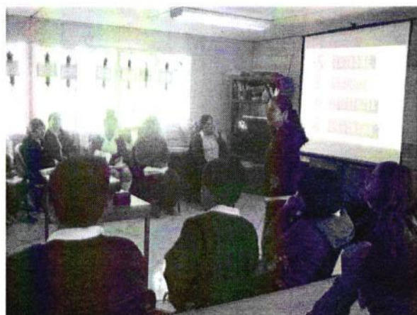
Telesecundaria El Sauz