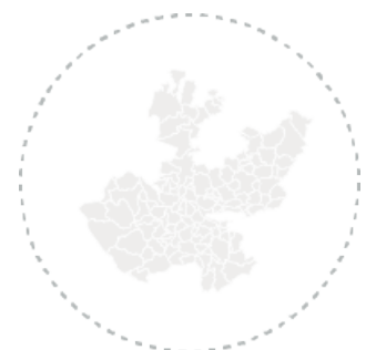
Por área metropolitana de Jalisco