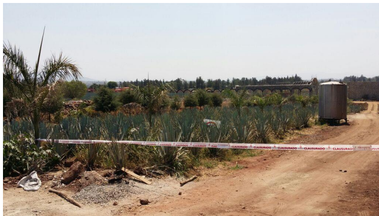
Autor: Enrique Cortés Ballesterero, Industria Tequilera, Tlajomulco de Zúñiga, Jal.