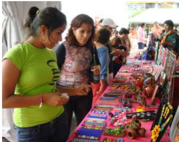
Venta de artesanías en pabellón