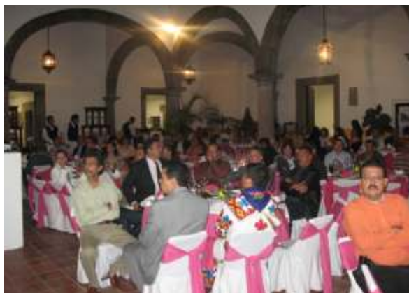
Ceremonia de Premiación

Originario del municipio de Colotlán, sus 78 años de trayectoria dedicándose a la talabartería, lo hicieron partícipe de ferias de talla nacional e internacional, elaborando artículos de piel para personalidades del mundo artístico, político y religioso.