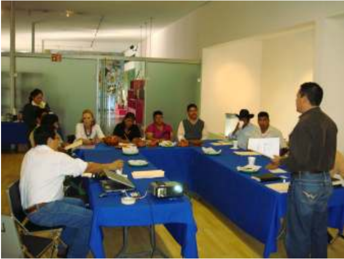
Asesoría para artesanos en las instalaciones del IAJ