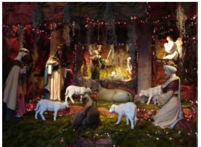
Nacimiento instalado en el IAJ

En el mes de Diciembre se envió un Nacimiento para adornar “Casa Jalisco” y se instaló otro en el propio Instituto.