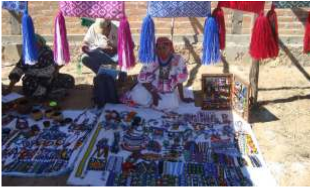
Compra de artesanía en la Zona Wixárika