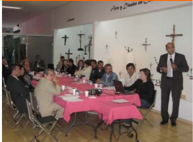
24 de febrero