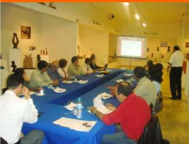
29 de Septiembre