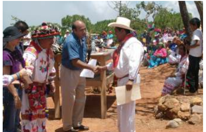
Entrega de reconocimientos a los artesanos ganadores