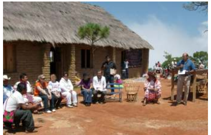
Mensaje de agradecimiento a los artesanos participantes