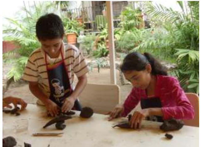
Taller Manos de Barro