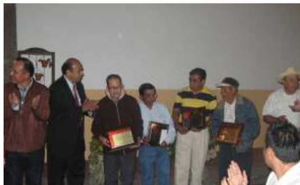
Artesanos galardonados en el Día del Artesano