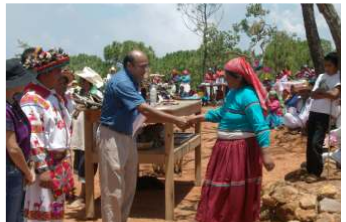
Premiación en la Comunidad de San Andrés Cohamiata