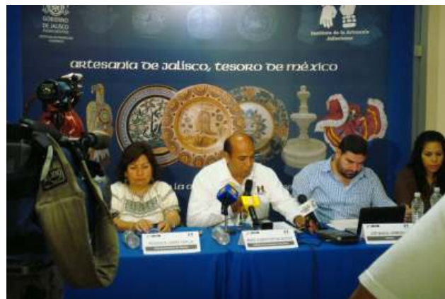
Rueda de prensa para dar a conocer detalles de la Ley

(Para ver el contenido de la Ley Federal para el Fomento, Desarrollo y Promoción de la Actividad Artesanal ingresa a www.artesaniajalisco.gob.mx )