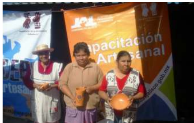
Curso de vidriado sin plomo, Cuquío, Jal.