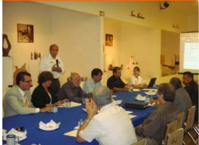
28 de Julio