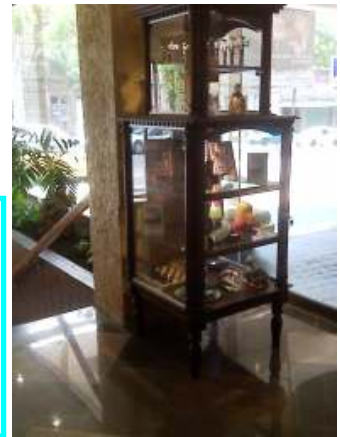
Exhibidores en hoteles