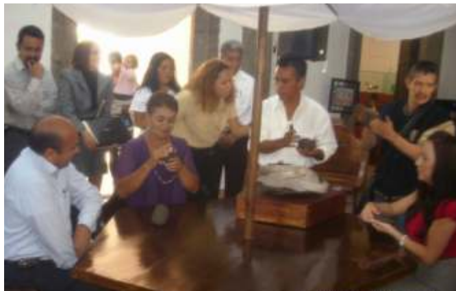
Autoridades del IAJ con la Cooperativa TLAQUEEXPORT

De esa manera el IAJ logró la creación de 6 asociaciones durante el 2010, además de obtener el título de la marca MASLE Asociación de piedra de basalto de San Lucas Evangelista A.C., en Tlajomulco de Zúñiga, registro 1091384 y se agilizó el título de la marca CHAMAN con el número de título 1152739 de fecha 14 de abril del 2010, expediente completo.