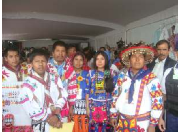
Artesanos indígenas que radican en Zapopan

·Asimismo, se desarrollaron Talleres para los visitantes, entre los que destaca el de la Lotería Wixárika , logrando atender a más de 600 visitantes .