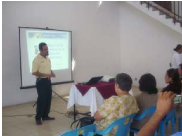
Acercamiento artesanal en el municipio de Tequila