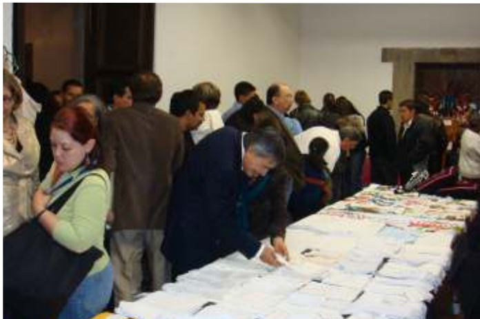
Público admirando piezas participantes