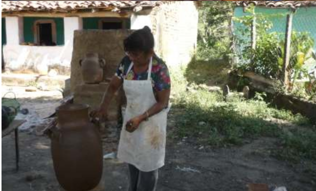
Curso de esmalte vidriado sin plomo en la Comunidad de Huista en Villa Purificación

El costo por cada horno fue de $80,000.00, teniendo una inversión de $240,000.00 financiado por FONART.