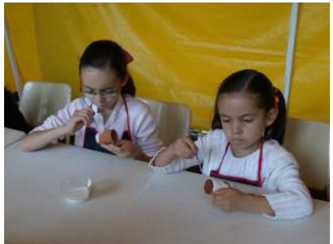
Taller Decora tu Jarrito