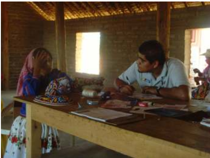
Registro de Artesanos en la Comunidad de San Andrés Cohamiata