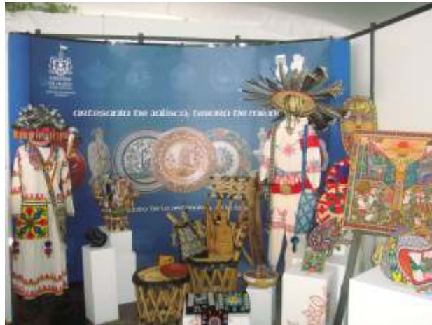
Exhibición de piezas ganadoras del primer y segundo Certámen de Arte Wixárika