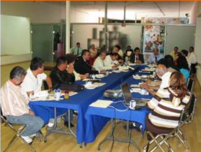
19 de Mayo