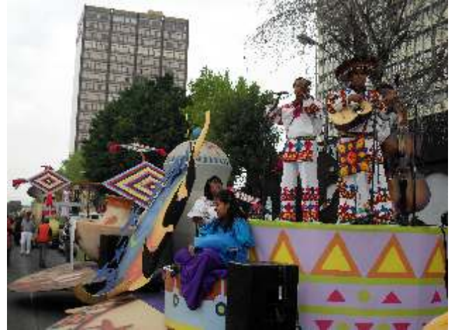
Mariachi Wixárika Tamatsin