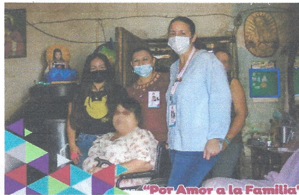
"Por Amor a la Familia"

Se realizó entrega de silla de ruedas a persona con discapacidad, misma que tiene procedencia de donación, con este apoyo se contribuye en la mejora de calidad de vida de personas de atención prioritaria.