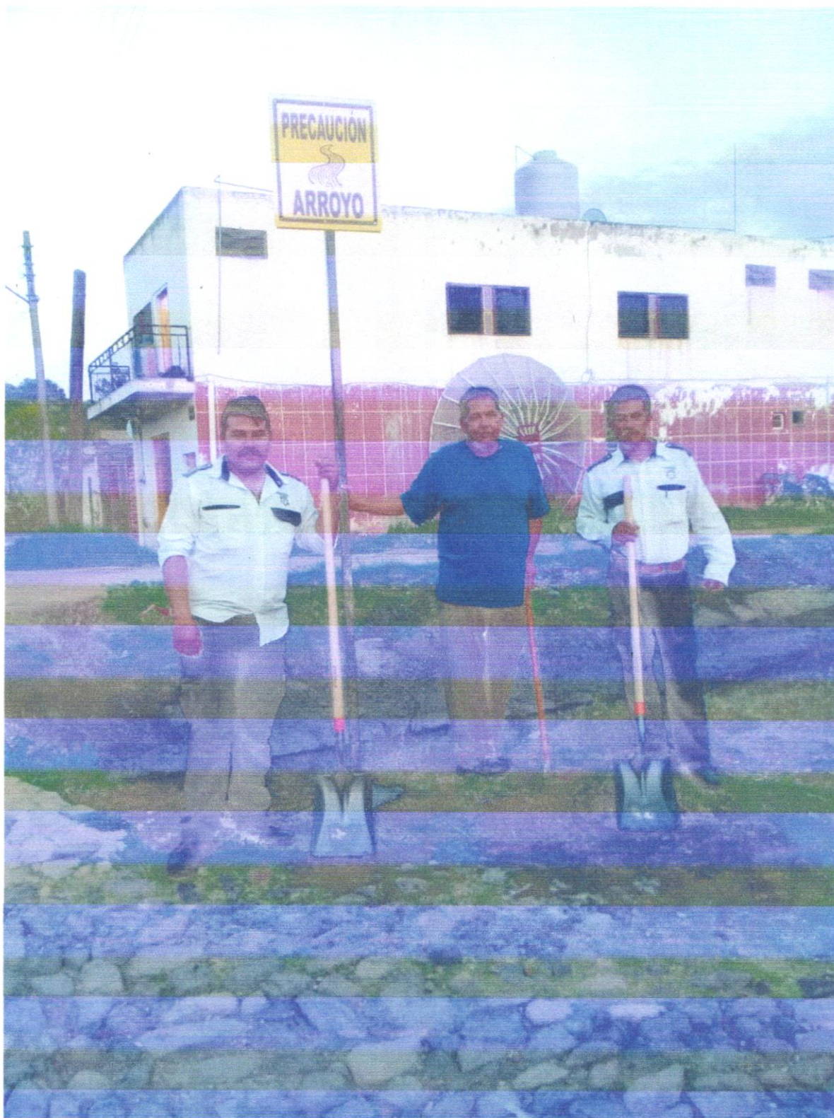
Se instalaron señalamientos preventivos en la comunidad de agua caliente, lo anterior con la finalidad de evitar accidentes viales.