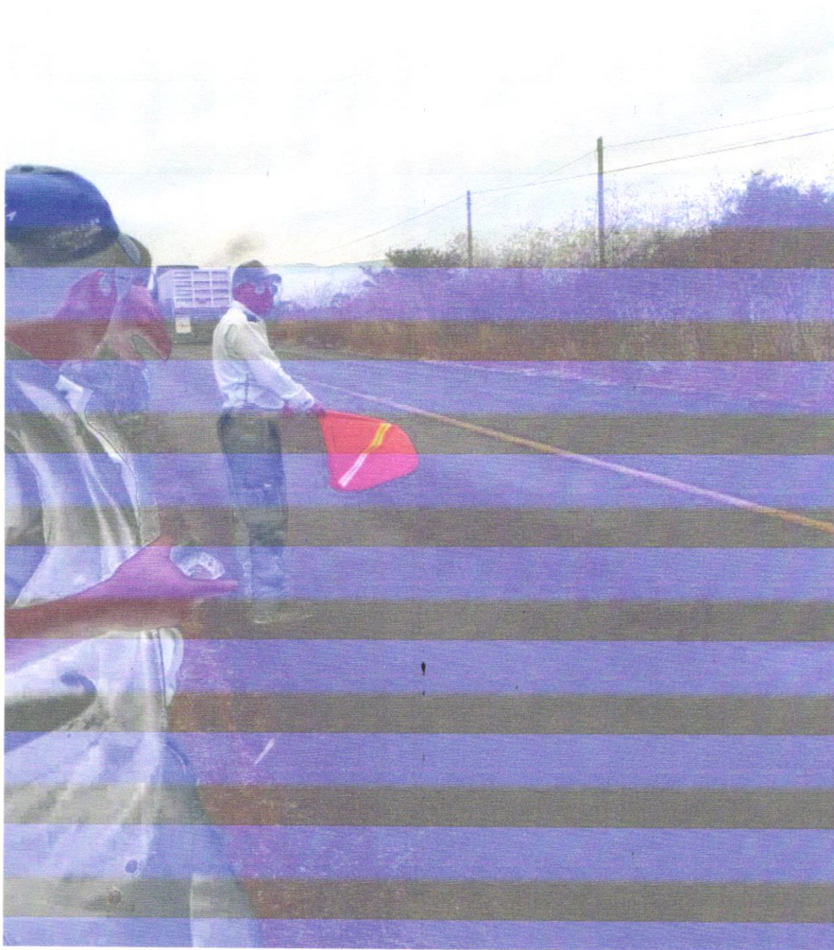
Apoyo en carreteras estatales y federales en accidentes de tránsito.