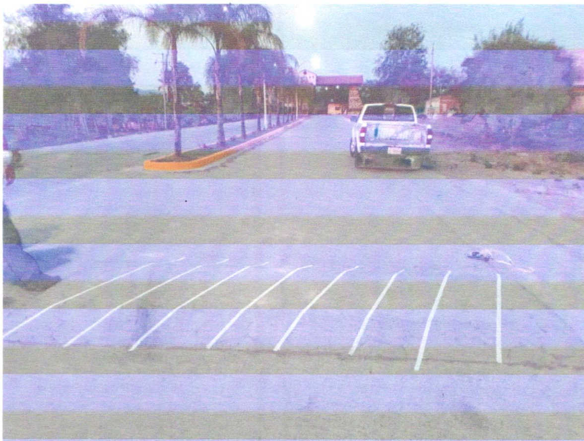
Balizamiento de reductores de velocidad en el ingreso principal de San Nicolás.