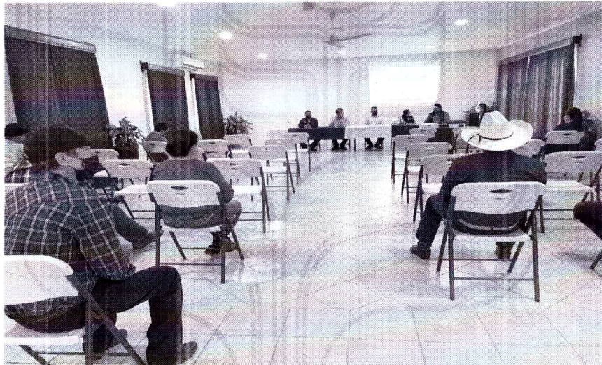
En la reunión participaron delegados y comisariados.

Portal Obregón #30 Cocula, Jalisco, México Tel: (377)773-00-00