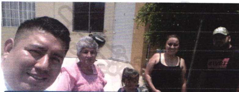
Visita a villas de san diego por denuncia ciudadana para notificar a los dueños de 2 perros cachorros que andaban haciendo destrozos en los jardines de los vecinos acompañado de la dirección de protección animal.