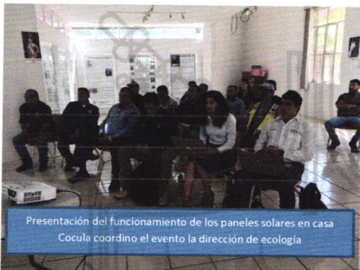
Presentación del funcionamiento de los paneles solares en casa Cocula coordino el evento la dirección de ecología