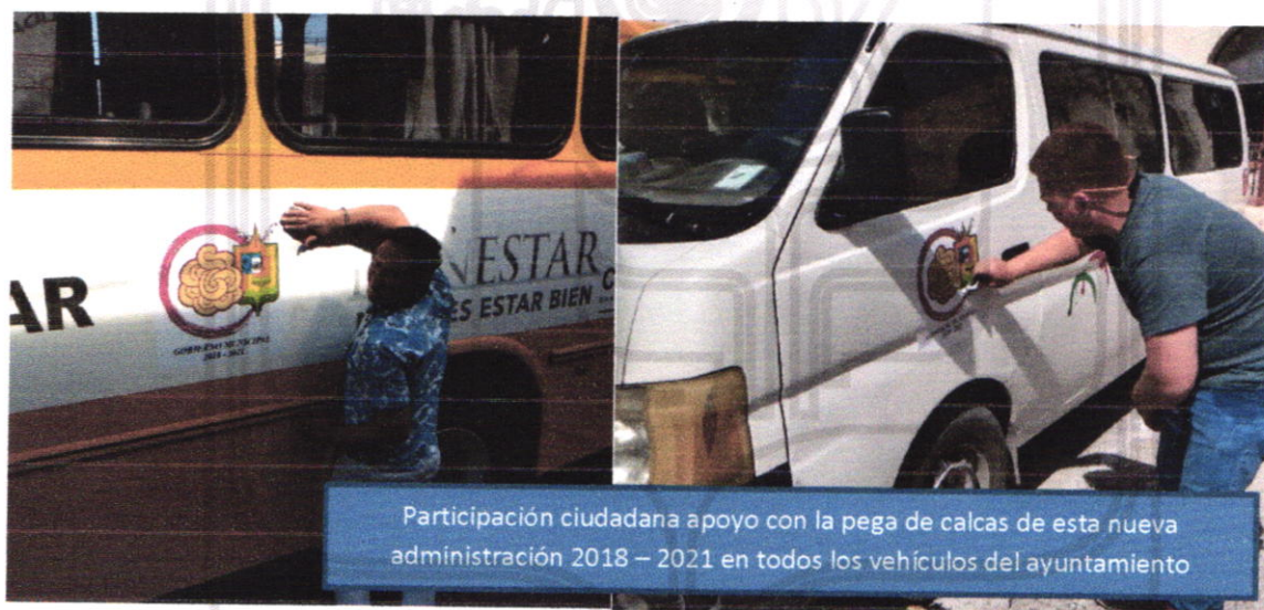
Participación ciudadana apoyo con la pega de calcas de esta nueva administración 2018 – 2021 en todos los vehículos del ayuntamiento