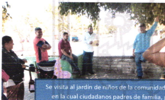
Se visita al jardín de niños de la comunidad San Nicolás, en la cual ciudadanos padres de familia, gobierno e iniciativa privada buscan aportar materiales y efectivo para el mejoramiento del cerco de la escuela.