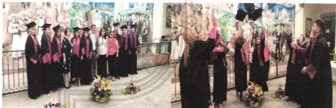
Graduación Colegio Valles (Prepa abierta)

Por un municipio sin rezago educativo, el día 2 de abril egresó la 3era generación de la preparatoria abierta, fueron 8 alumnos los que concluyeron el bachillerato es una oportunidad más que se ofrece a los adultos para seguir su proyecto profesional por voluntad propia en espacios particulares.