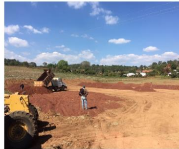
Construcción de cancha de fútbol en la localidad Corral Falso