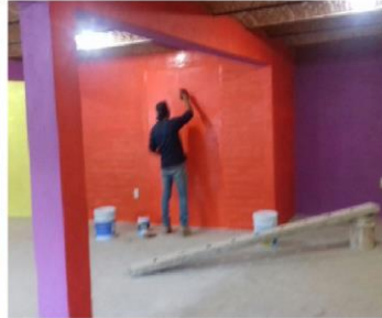
Construcción de Unidad regional de rehabilitación en el DIF