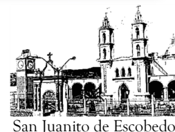
San Juanito de Escobedo

Mexicana se conmemora la Batalla de Puebla , en la que las tropas invasoras francesas fueron derrotadas por las fuerzas mexicanas, comandadas por el general Ignacio Zaragoza (1858).