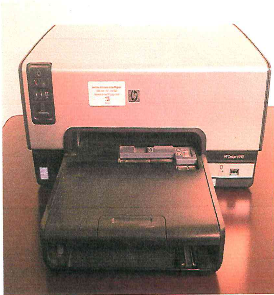
Impresora de Tinta HP DESKJET 6940