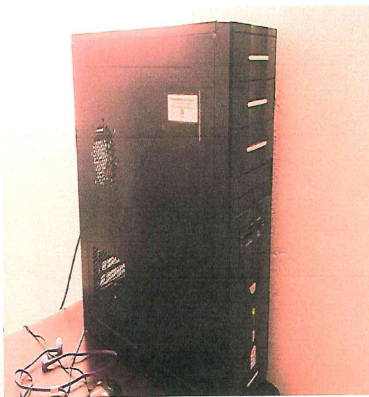
CPU computadora ensamblada MX-3167