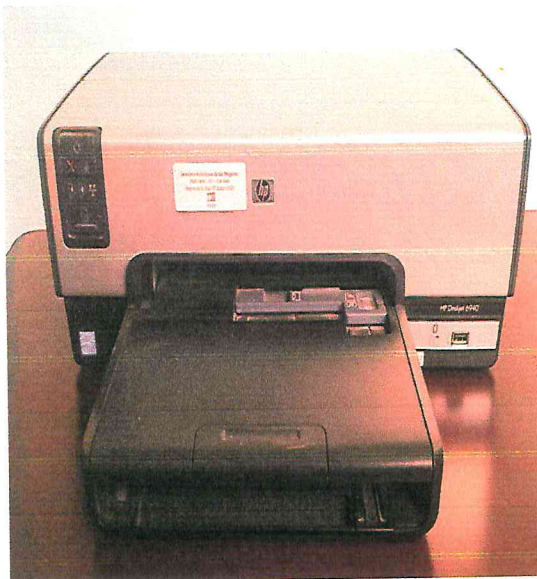
Impresora de Tinta HP DESKJET 6940