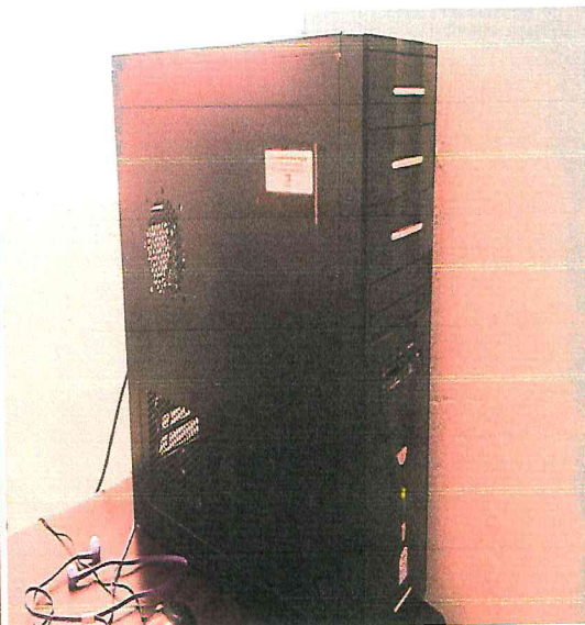
CPU computadora ensamblada MX-3167