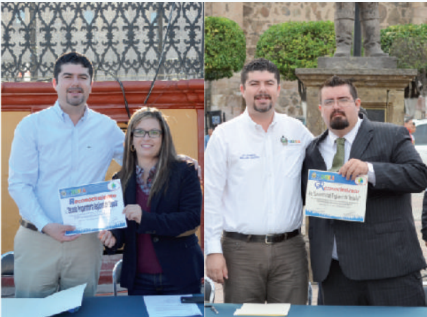
Reconocemos a las instituciones educativas por su participación en los Actos Cívicos.