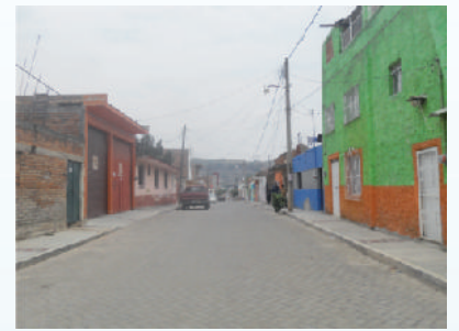
Adoquín calle Dr. Carlos Palomera.

En estas importantes vialidades colocamos 11 mil 812 M2 de adoquín, cambio de redes de agua y drenaje con su respectiva toma de cada vivienda, además de la reposición de banquetas para unificar niveles y rampas para discapacitados. Esta obra benefició directamente a más de 4 mil 500 tequilenses e indirectamente a toda la población.