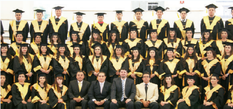
Padrino de la Primera Generación de egresados de la Universidad Regional de Tequila.