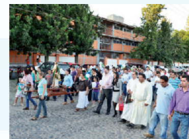
Fiestas de San Judas Tadeo.