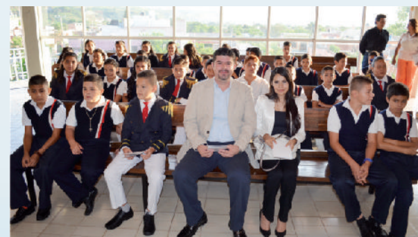
Tradicional Mega Rosca de Reyes