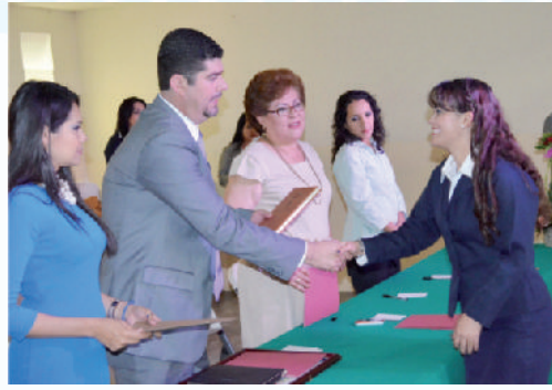
Padrino de generación del Instituto Gabriela Mistral.