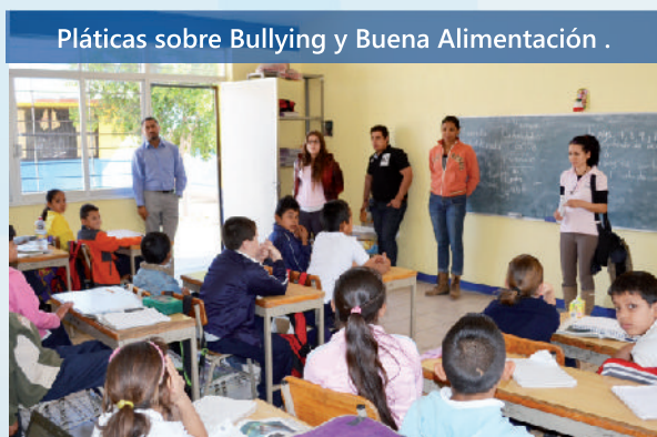
Pláticas sobre Bullying y Buena Alimentación .