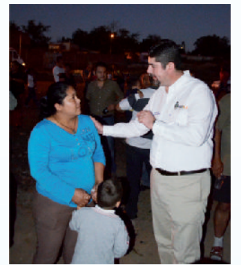
En la colonia Mayahuel.