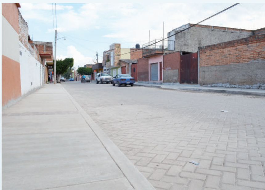
Adoquín calle Emiliano Zapata.

En estas importantes vialidades colocamos 11 mil 812 M2 de adoquín, cambio de redes de agua y drenaje con su respectiva toma de cada vivienda, además de la reposición de banquetas para unificar niveles y rampas para discapacitados. Esta obra benefició directamente a más de 4 mil 500 tequilenses e indirectamente a toda la población.