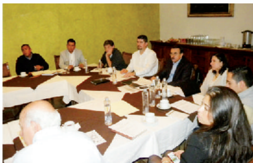
Reuniones del Comité Turístico de Tequila "Pueblos Mágicos".