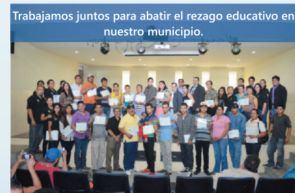
Trabajamos juntos para abatir el rezago educativo en nuestro municipio.