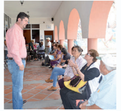
Con los adultos mayores.