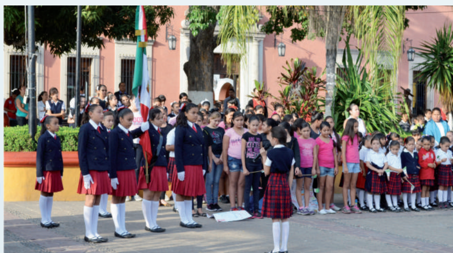
Coordinación de Actos Cívicos y Desfiles.

En total de los tres años de Gobierno realizamos 35 Honores a la Bandera.