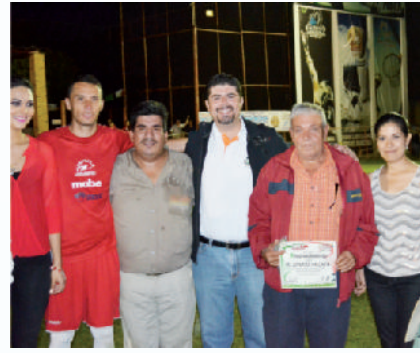
Premio económico al campeón de fútbol del Torneo de Festejos Patrios 2014.