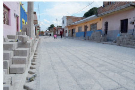
Colocación de adoquín calle Dr. Carlos Palomera.