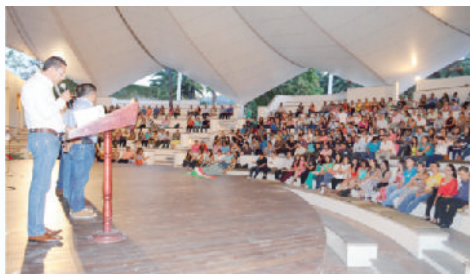
Festejamos en su día a los maestros(as) de Tequila.