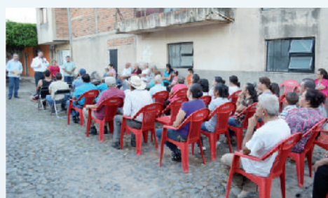
Reunión en calle Emiliano Zapata.