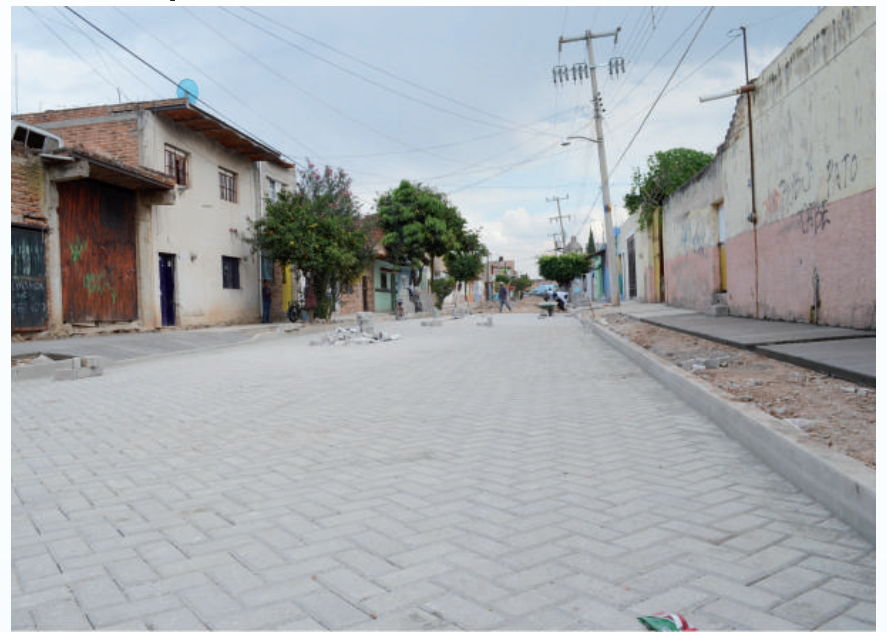
Colocación de adoquín calle Ejido.