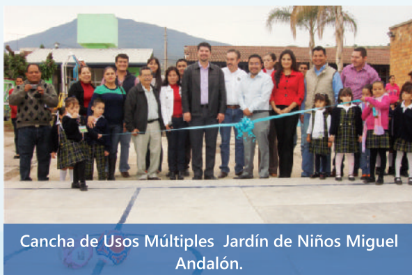
Cancha de Usos Múltiples Jardín de Niños Miguel Andalón.

“Estas son acciones que realizamos durante nuestra administración a favor de la educación para construir un mejor municipio, ya que los niños(as) y jóvenes son el futuro de México.”