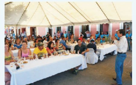
“ Festival de Jima”