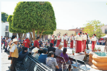
Festival “Verbenas de Tradición”