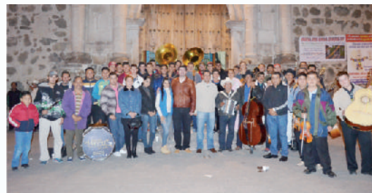
Día del Músico.