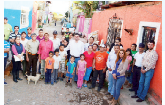
Colocación de adoquín El Medineño.