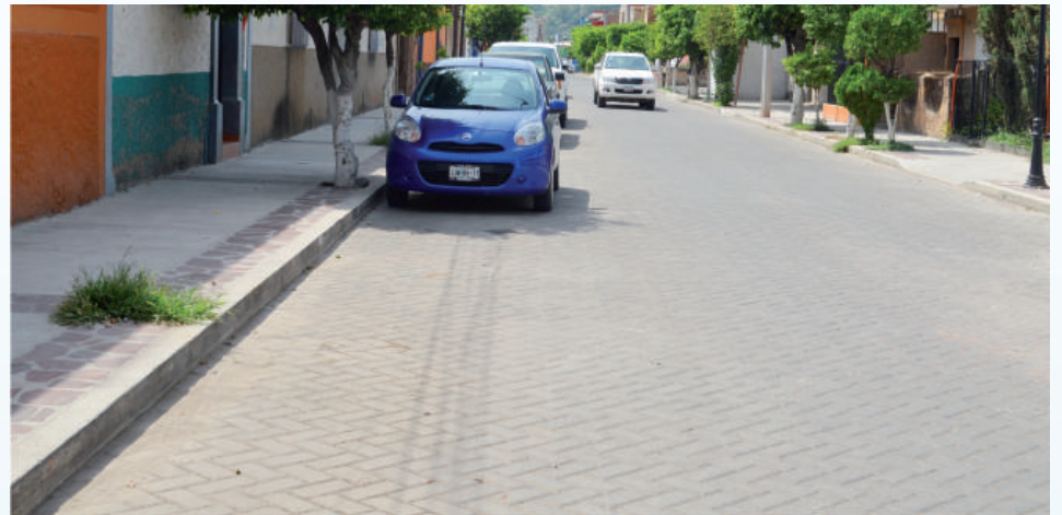
Calle Francisco I. Madero.

Esta calle reabrió su circulación de Leandro Valle a Álvarez Maciste, en el pasado mes de diciembre, la cual presenta una mejor imagen urbana y servicios básicos de calidad para las familias que viven en este lugar.