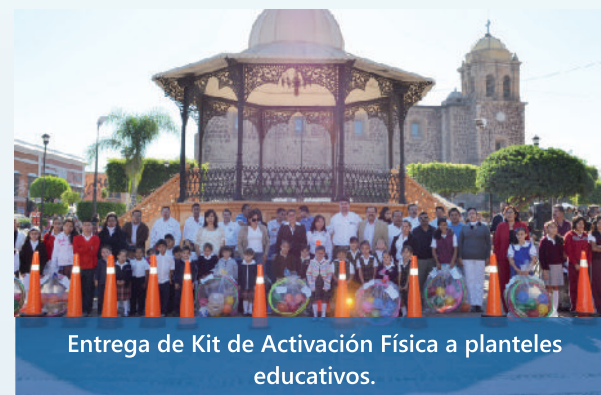
Entrega de Kit de Activación Física a planteles educativos.