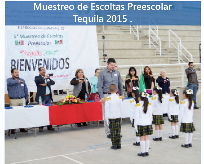
Muestreo de Escoltas Preescolar Tequila 2015 .