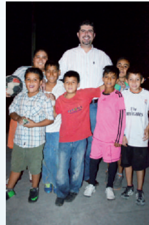
Conviviendo con niños de la colonia Infonavit Viejo.