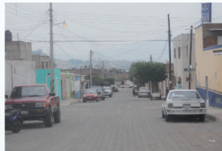
Adoquín calle Lázaro Cárdenas.