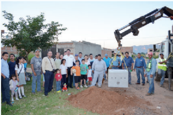
Colonia "Valle del Sol"

Por tercer año seguimos trabajando juntos cumpliendo uno a uno los compromisos con la sociedad, con el propósito de que todas las familias vivan mejor. Llevamos a cabo 3 electrificaciones más, una en la colonia Mayahuel, otra en el fraccionamiento Macedo Ruiz y en la Fundición. Con un total de 4,364 metros lineales de tendido eléctrico, que incluye transformadores, registros y postes con luminarias.