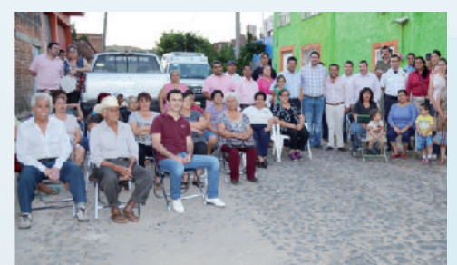
Adoquín calle Leandro Valle.