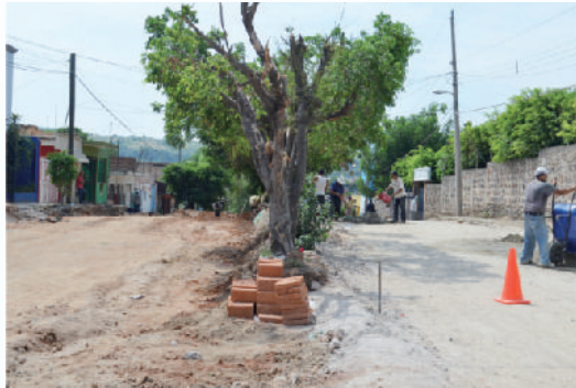
Obra en proceso en calle López Mateos.