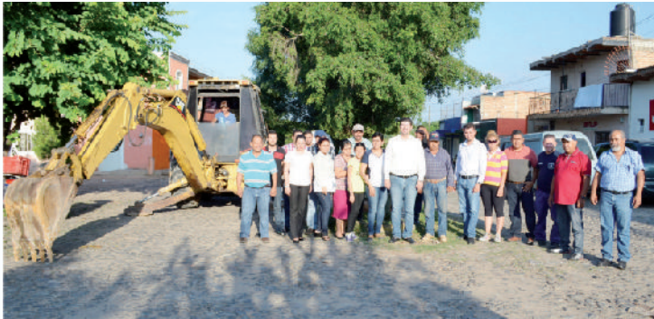
Arranque adoquín calle López Mateos segunda etapa.

Actualmente trabajamos en la colocación de 2 mil 120 M2 de adoquín y la unificación de niveles de las banquetas. Además se revisarán las condiciones de la toma y descarga de agua y drenaje respectivamente, y según sea necesario se cambiarán, para que cada vivienda tenga un servicio óptimo.