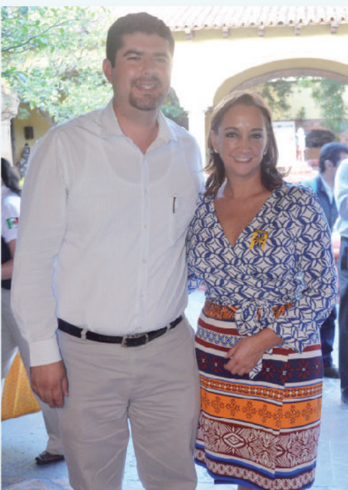
Recibimos la distinguida visita de la Secretaria de Turismo Federal Claudia Ruiz Massieu.

En los tres años de gobierno llevamos a cabo los festivales “El Mango y la Ciruela”, “Tequila Café y Recuerdos” el “Festival de la Jima” y las “Verbenas de Tradición”. En este periodo la XXXVIII edición Feria nacional del Tequila, la celebración del 485 aniversario de la Villa de Santiago de Tequila y por ultimo tendremos el 2do. Congreso de la Medicina Natural Alternativa.