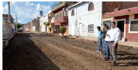
Supervisión de obra en calle Ejido.