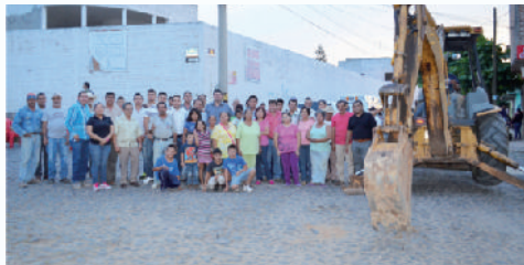
Reunión con vecinos calle Ejido.

Las obras de adoquinamiento son necesarias para una ciudad que crece como Tequila, ya que mejora la imagen urbana, el tráfico vehicular, peatonal y son más seguras, al tiempo que se traducen en beneficios directos para los ciudadanos.