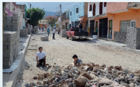
Adoquín calle Leandro Valle.