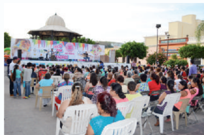
Organizamos el Festival del Día de la Madre.

Por tercer año brindamos apoyo a festividades y tradiciones religiosas; Fiestas Patronales, Día de Muertos, Día de Santa Cecilia, así como eventos de índole social y educativo (Día de la Madre, del Maestro, del Músico, entre otros.)