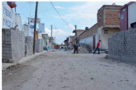
Inicio adoquín calle Dr. Carlos Palomera.