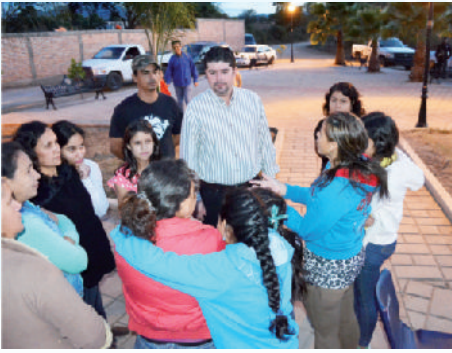
En San Pedro de los Landeros.