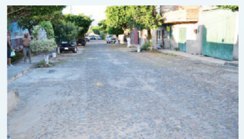
Antes calle Emiliano Zapata.