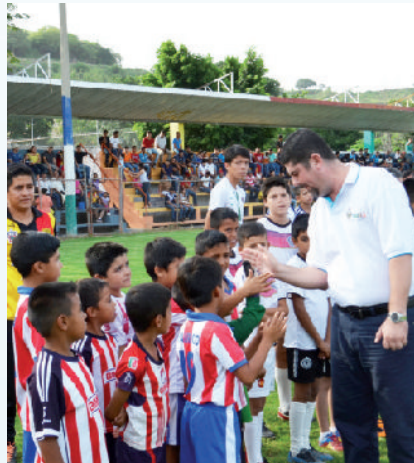
Saludando a niños futbolistas tequilenses.