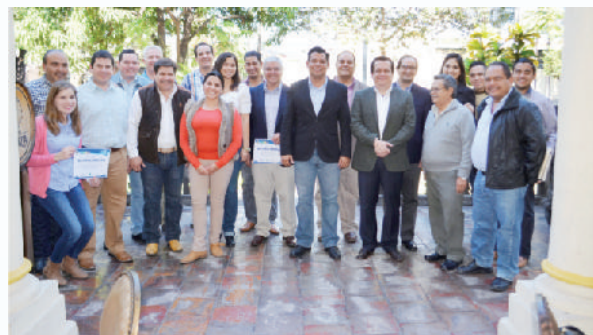
Taller "Modelos de Asociación Público Privada".