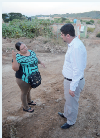
Empedrado en calle Destilería

Por tercer año en la cabecera municipal realizamos obras de empedrado en las calles: Encino, Nopal, Héroes de Nacozari, Pino, 2da etapa camino a la colonia Valles del Sol, Privada Valle de Tequila, 2da etapa camino al Tecnológico y en Calle Destilería, con un total de 25,686 M2 beneficiando a más de 3 mil tequilenses.