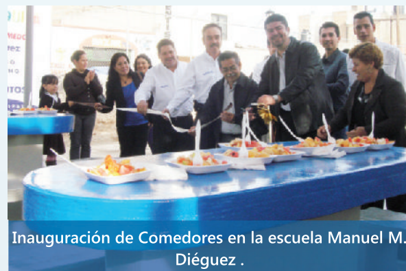
Inauguración de Comedores en la escuela Manuel M. Diéguez .