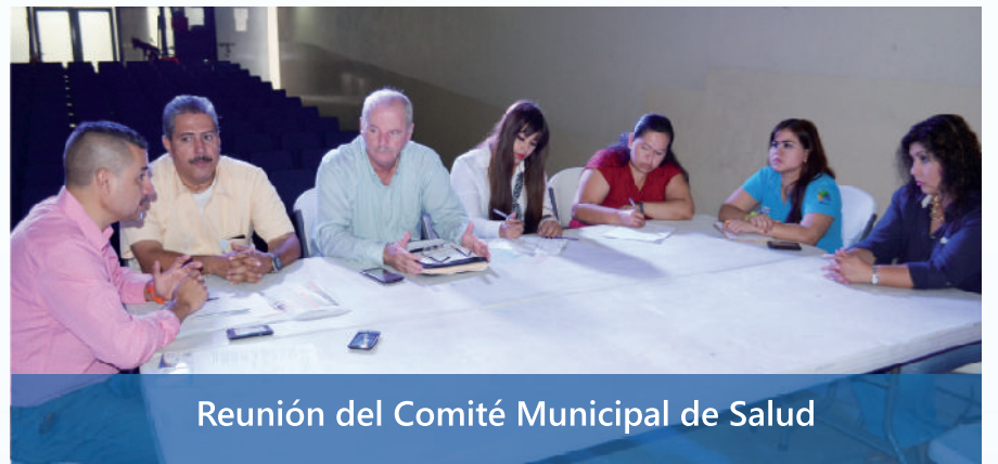
Reunión del Comité Municipal de Salud