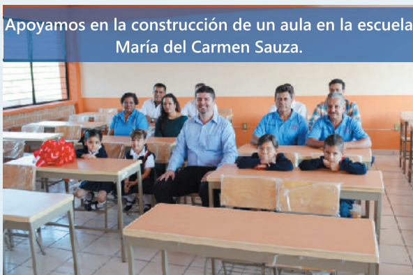
Apoyamos en la construcción de un aula en la escuela María del Carmen Sauza.