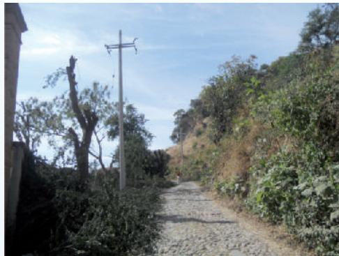
Camino a "La Fundición"