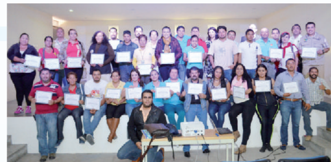
Capacitación Guías de Turistas.

"Sin duda Tequila se sitúa dentro del gusto y la preferencia de la gente y como Gobierno Municipal, trabajamos juntos con el Comité local de Pueblos Mágicos, gestionamos satisfactoriamente un recurso por la cantidad de 25 millones de pesos que serán aplicados en este año 2015 en beneficio directo de toda la población y turismo que nos visita tanto del país como del extranjero.