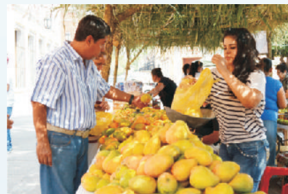
“Festival del Mango y la Ciruela”