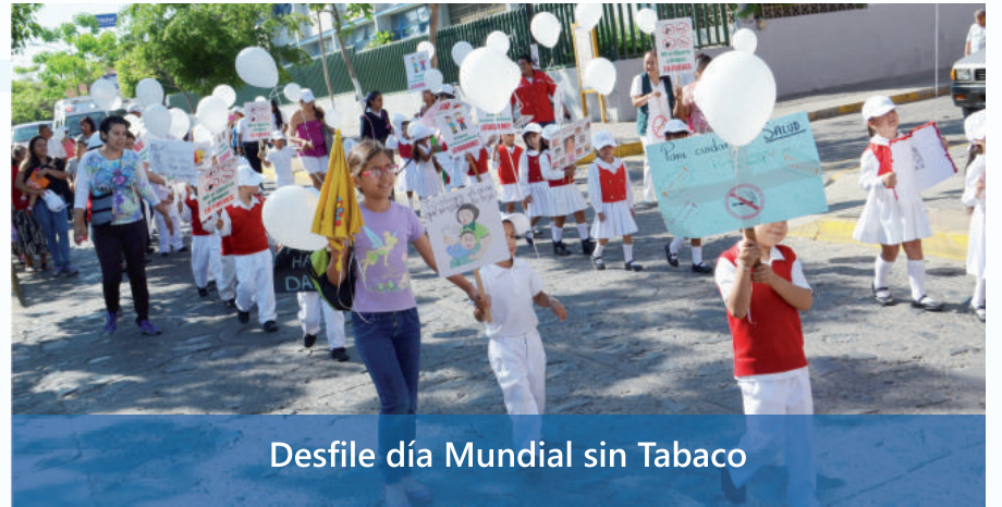
Desfile día Mundial sin Tabaco

Total de pacientes atendidos:.....4,200 atenciones Total de certificados médicos:.....544 certificados Total de hospitalizaciones: .....423 pacientes Certificado de defunción:.....250 certificados Total traslados hospital regional magdalena:.....207 pacientes Total de referencias a especialistas:.....468 pacientes Total de consultas generales:.....2,526 pacientes