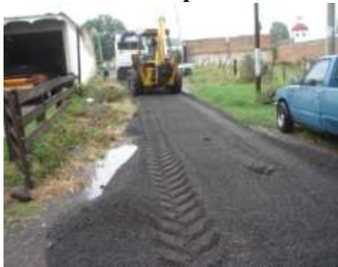
Privada de Corregidora