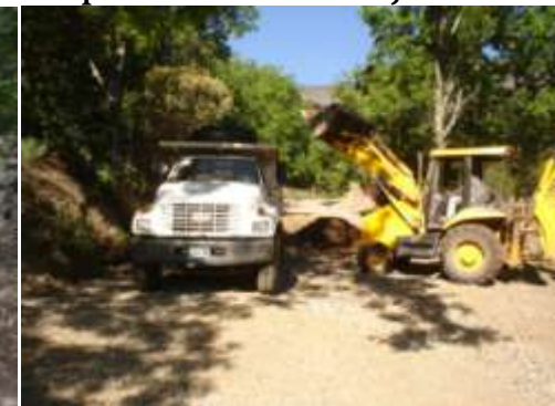
Brecha en Aguacatita-Amial