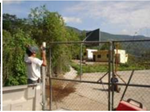
Calle Ramón Corona Malla y Baños en Escuela del Apartadero