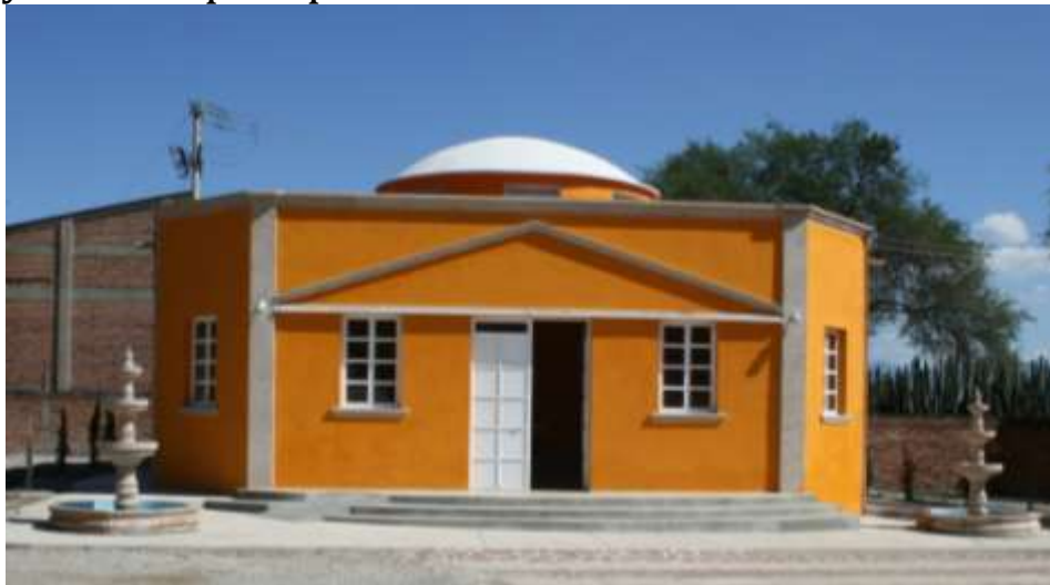
Descanso Panteón de Amacueca