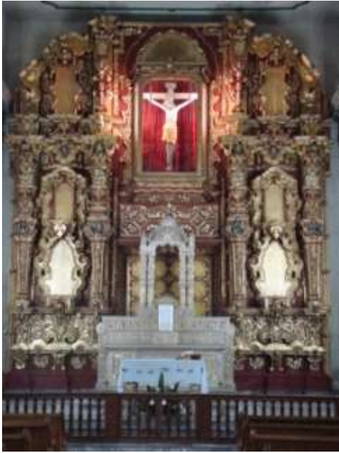
3.- Construcción del Portal de Usos Múltiples