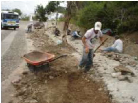
Entrada de Tepec