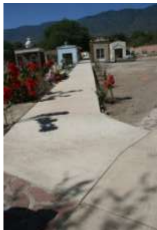
Andador Panteón Amacueca