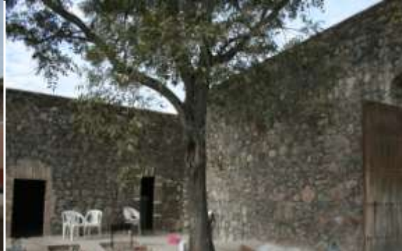
10.- Campanario y Escaleras