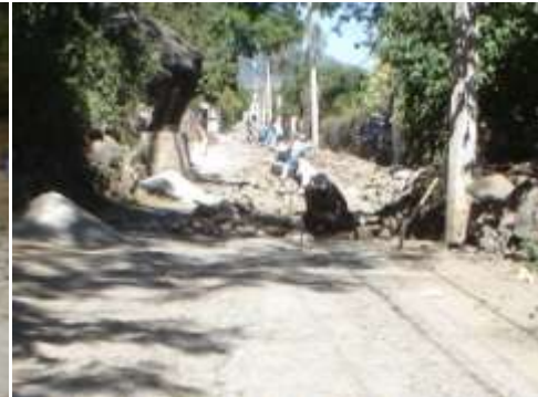
Calle Matamoros de Tepec