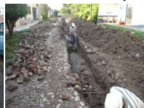
Reparación Drenaje Cofradía