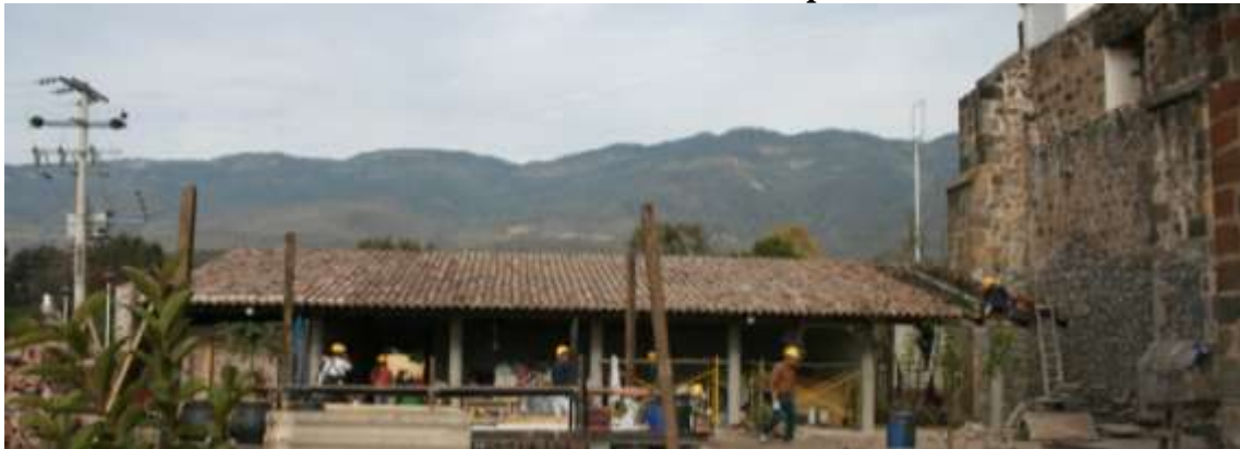
4.- Construcción de Capilla de Velación