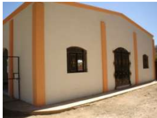
Descanso del Panteón de Tepec