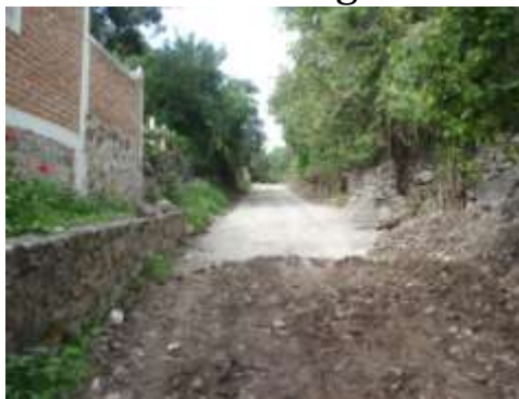
Salida a La Barranca