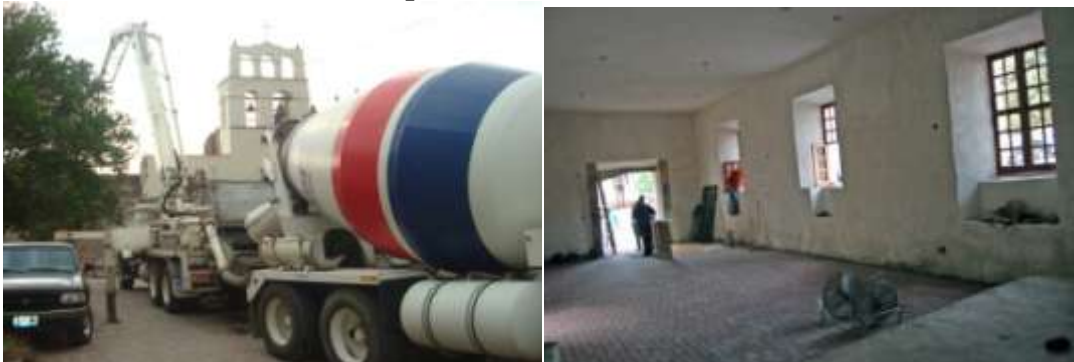
5.- Adaptación de espacios para Museo de Arte Sacro