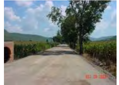
Foto 1.39 Pavimentación de ingreso carretero a Santa Rosa de Lima.