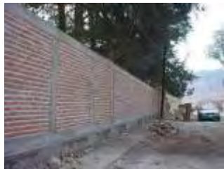
Foto1.23 Construcción de muro perimetral Esc. Sec. Foránea #6.