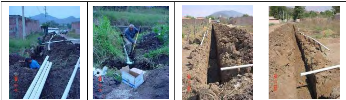
Ampliación de red de agua en la colonia Guadalupeana y continuación en carretera Guadalajara - Barra de Navidad (salida a Autlan) 550 metros lineales de tubo de 2 1/2.