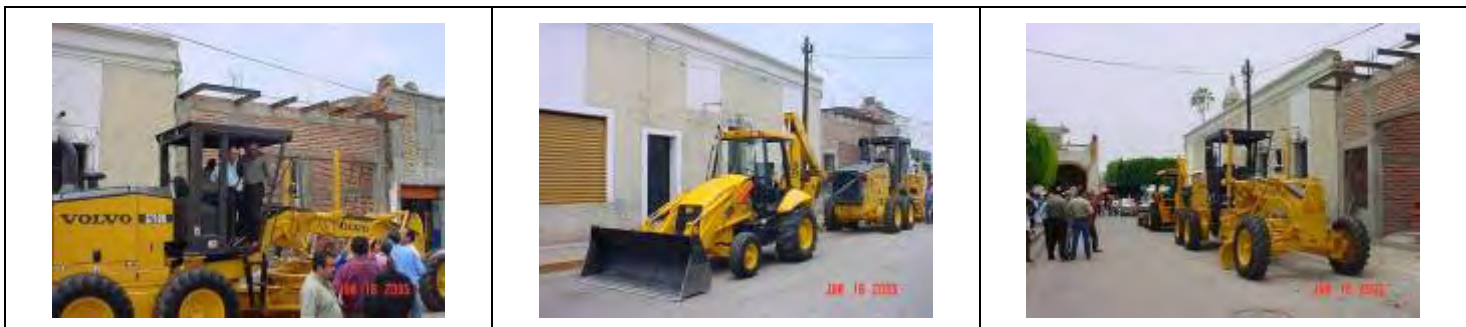
Fotos 1.3 Entrega De La Maquinaria Adquirida; Retroexcavadora Estándar MC. JCB Motoconformadora MC. Volvo