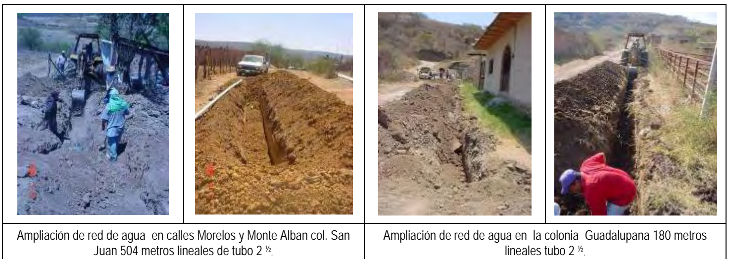
Ampliación de red de agua en calles Morelos y Monte Alban col. San Juan 504 metros lineales de tubo 2 ½.