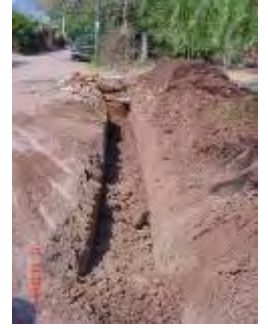
Foto 1.37 Ampliación de red de drenaje en La Piñuela.