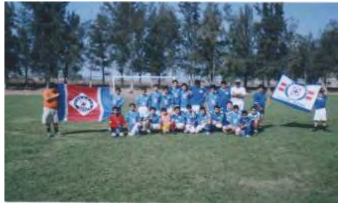
Equipo Cruz Azul "campeón de la liga infantil"

Tomando en cuenta que nuestro municipio cuenta con una estructura poblacional, en el que el mayor número de habitantes se encuentra en el rango de jóvenes con aptitudes para practicar deporte, y con la firme intención de recuperar, promover y fomentar el hábito deportista en nuestros niños, jóvenes y adultos, se llevaron a cabo la organización de eventos tales como: Ligas Municipales de Fut-bol en sus distintas categorías, Liga Municipal de Básquetbol y la realización de 5 torneos de fútbol. Además, nuestro municipio fue sede de la 8ª Copa Coca Cola y participó en la Copa México Telmex de Fut-bol donde la selección del municipio obtuvo un honroso 2º lugar. Se contó con la presencia de los buscadores de talentos deportivos del Club Atlas .