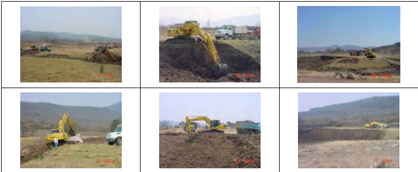
Fotos 1.2 Desasolve de la Presa de San José De Ávila (Primera Etapa).