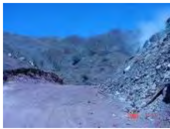
Foto 1.25 Acondicionamiento del basurero.