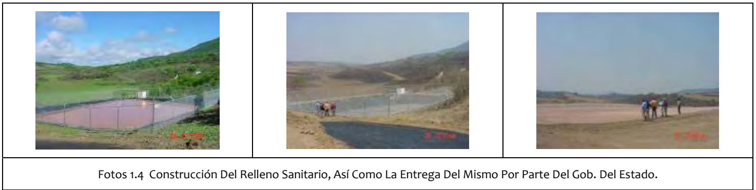
Fotos 1.4 Construcción Del Relleno Sanitario, Así Como La Entrega Del Mismo Por Parte Del Gob. Del Estado.