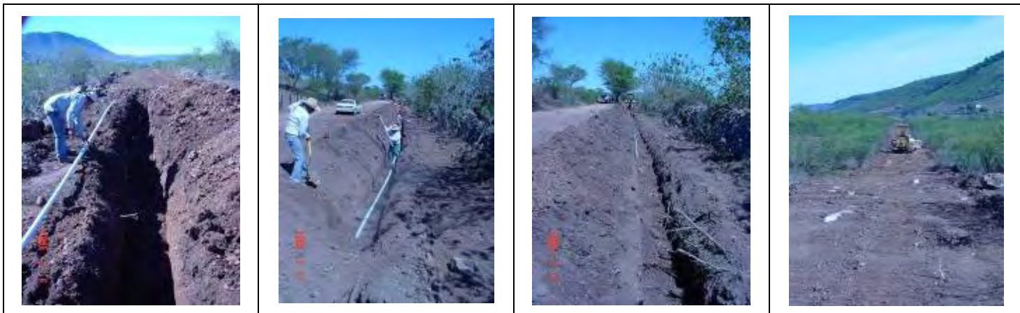
Construcción de red de agua para la comunidad de Santa Ana 2,700 ml tubo de 2".