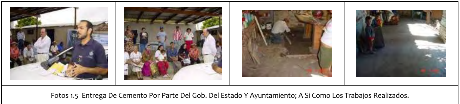
Fotos 1.5 Entrega De Cemento Por Parte Del Gob. Del Estado Y Ayuntamiento; A Si Como Los Trabajos Realizados.

Por segunda ocasión nos vimos favorecidos con el Programa "PISO FIRME 2005" mediante el cual 75 viviendas de las comunidades de Ixtlahuacán de Santiago, Tacotán, Alpatahua, San José de Ávila, San Agustín, Manzanillito, Santa Fe, San Cayetano, y la Cabecera Municipal que tenían piso de tierra, hoy cuentan con piso de cemento, aplicándose un total de 31.5 toneladas de cemento como participación del Estado, el Ayuntamiento otorgó el material (Grava-Arena) y los beneficiados participaron con la mano de obra. Fotos 1.5.