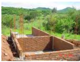
Foto 1.19 Construcción de fosa séptica en La Alpatahua