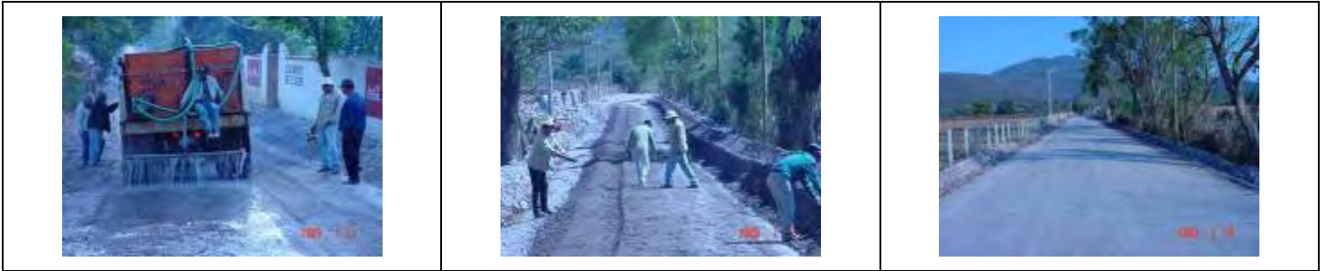
Fotos 1.7 Aplicación De CBR PLUS Y Obras Secundarias En San José de Ávila.

Aplicación de CBR plus en ingreso carretero a San José De Ávila. Fotos 1.7.