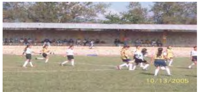
Torneo Regional Infantil de Futbol, (rama femenil)

Tomando en cuenta que nuestro municipio cuenta con una estructura poblacional, en el que el mayor número de habitantes se encuentra en el rango de jóvenes con aptitudes para practicar deporte, y con la firme intención de recuperar, promover y fomentar el hábito deportista en nuestros niños, jóvenes y adultos, se llevaron a cabo la organización de eventos tales como: Ligas Municipales de Fut-bol en sus distintas categorías, Liga Municipal de Básquetbol y la realización de 5 torneos de fútbol. Además, nuestro municipio fue sede de la 8ª Copa Coca Cola y participó en la Copa México Telmex de Fut-bol donde la selección del municipio obtuvo un honroso 2º lugar. Se contó con la presencia de los buscadores de talentos deportivos del Club Atlas .