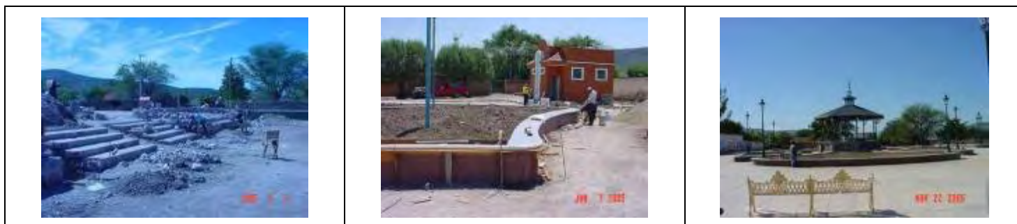
Foto 1.13 Construcción de plaza en San José de Ávila; donde se realizaron trabajos de construcciones de losas, graderías, electrificación, líneas de agua potable y alumbrado.