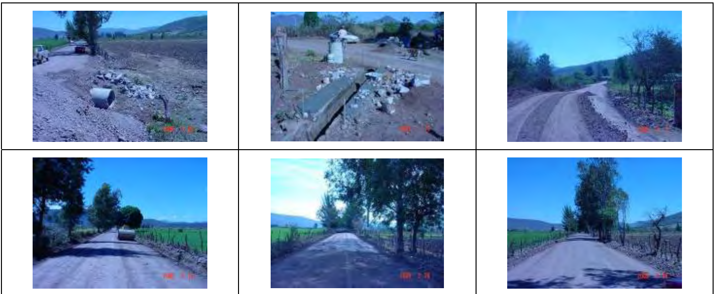
Fotos 1.8 Aplicación De CBR PLUS Y Obras Secundarias En Santa Rosa De Lima.

Aplicación de CBR plus en ingreso carretero a Santa Rosa De Lima. Fotos 1.8.