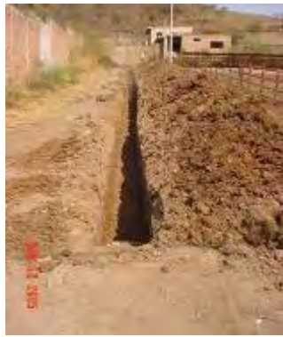
Foto 1.21 Ampliación red de agua potable en Col. Guadalupeana