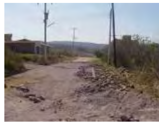
Foto 1.26 Bacheo de calles en la colonia Martinica.