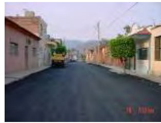
Foto 1.24 Aplicación de asfalto en calles Veracruz, Morelia, La Paz, Zacatecas.