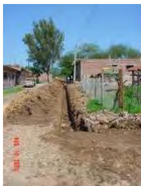
Ampliación de red de agua en calle Morelos junto a escuela Ricardo Flores Magón 60 metros lineales de tubo 2 1/2.

Con el objeto de establecer la organización y funcionamiento del Sistema de Agua Potable, así como de las actividades tendientes a la planeación, programación y ejecución de las obras de ampliación, rehabilitación y mejoramiento para el abastecimiento de agua potable, y las relativas al alcantarillado,