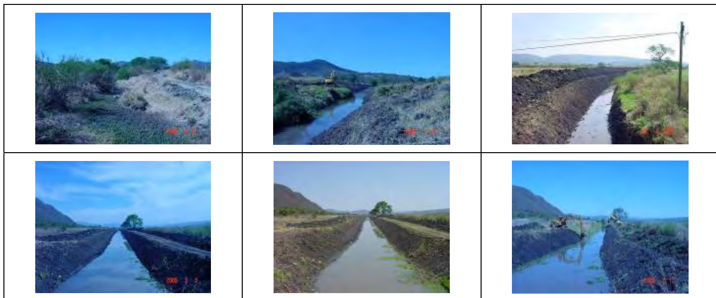
Fotos 1.1 Desasolve del Cause del Vallado de la Piñuela Al Ejido De San Agustín Antes y Después de la Obra.

A través del programa "PESO A PESO" de la SEDER adquirimos una máquina Motoconformadora marca Volvo $1'636,977.85 y una Retroexcavadora Estándar Marca JCB $561,009.28 con un monto total de inversión de $2'197,987.13 donde el Gobierno Estatal participa con el 50% y el municipio con el otro 50%. Foto 1.3