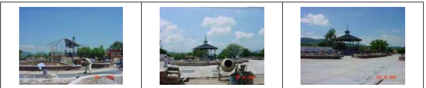
Fotos 1.12 Realizándose La Construcción Del Kiosco, Construcción De Losas, Compra De Luminaria Y Mucho Más.

Dentro de este programa se nos apoyo con $300,000.00 para la construcción de plaza principal en la comunidad de San José de Ávila; aportando el Ayuntamiento $218,681.89 Invirtiendo un total de $ 518,681.89 Fotos 1.12.