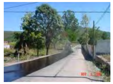
Foto 1.38 Pavimentación de ingreso carretero a San José de Ávila.