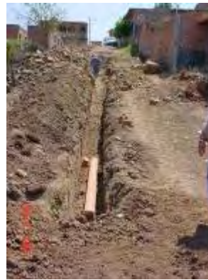
Foto 1.22 Ampliación de red de drenaje en colonia Guadalupeana