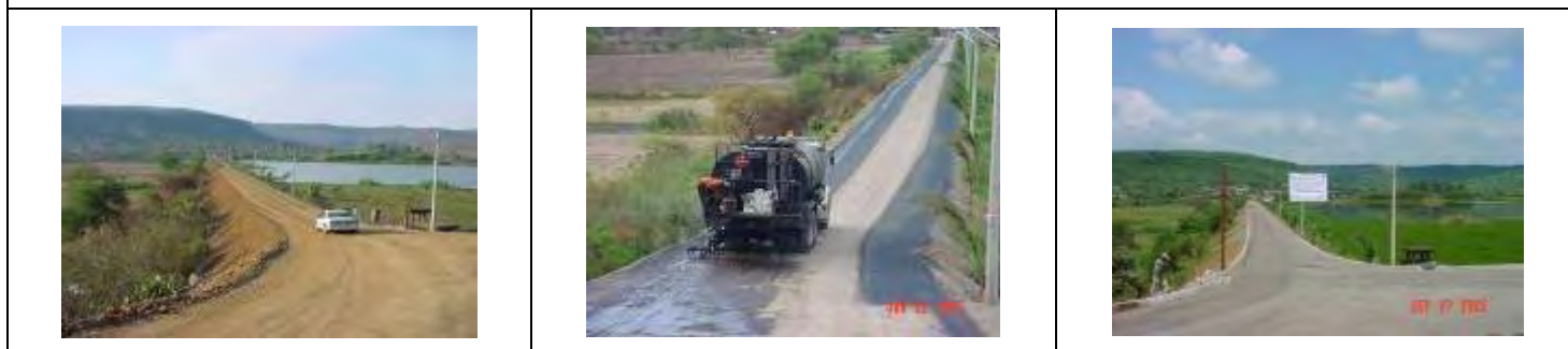
Foto 1.14 Pavimentación del ingreso carretero a San Agustín.