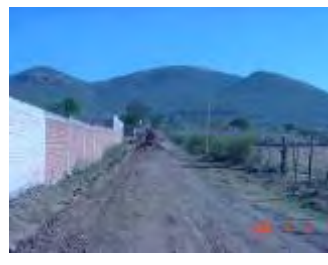
Foto 1.20 Ampliación red de agua potable en la Col. San Juan