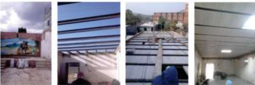
REHABILITACIÓN DE TECHO EN CASA EJIDAL DE IXTLAHACÁN DE SANTIAGO.

MONTO INVERSIÓN: $ $ 100,000.00 APOYO 50 % BENEFICIARIOS Y 50 % AYUNTAMIENTO