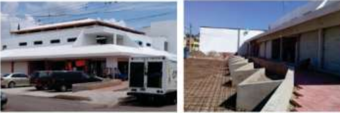
REHABILITACIÓN DEL MERCADO MUNICIPAL