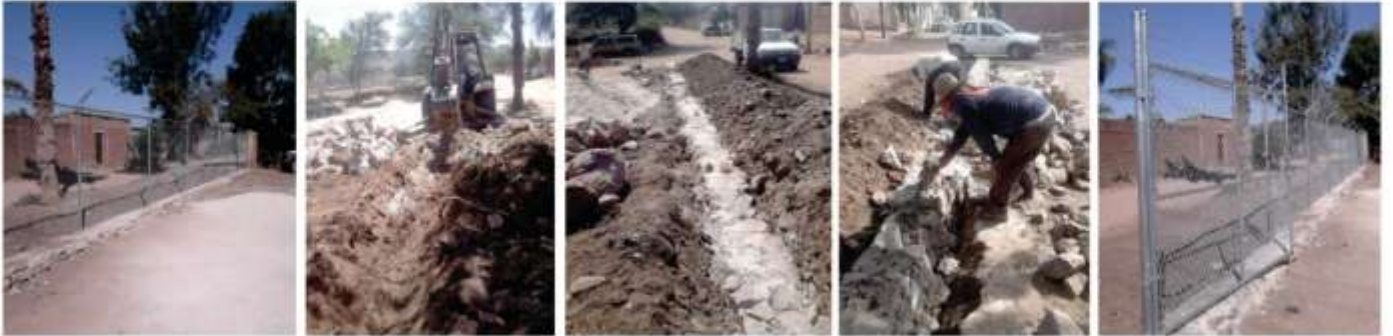
CONSTRUCCIÓN DE MALLA PERIMETRAL EN RASTRO MUNICIPAL DE UNIÓN DE TULA