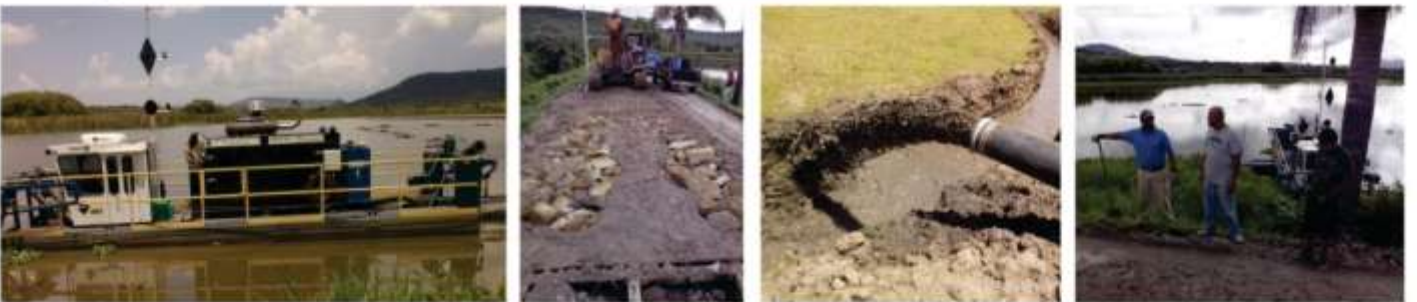
DESAZOLVE DE PRESA EN LA LOCALIDAD DE SAN AGUSTIN EL TRABAJO SE ESTA REALIZANDO POR PARTE DEL H. AYUNTAMIENTO EN COORDINACIÓN CON LA SECRETARIA DE DESARROLLO RURAL (SEDER) ES UNA INVERSIÓN INDEFINIDA YA QUE NO SE TIENE LA CERTEZA DE LAS CONDICIONES CLIMATOLÓGICAS, Y LA CANTIDAD DE AZOLVE QUE EL BORDO TENGA.