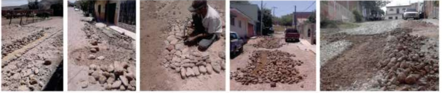
PROGRAMA PERMANENTE DE BACHEO EN DIFERENTES CALLES DE LA CABECERA MUNICIPAL DE UNIÓN DE TULA.