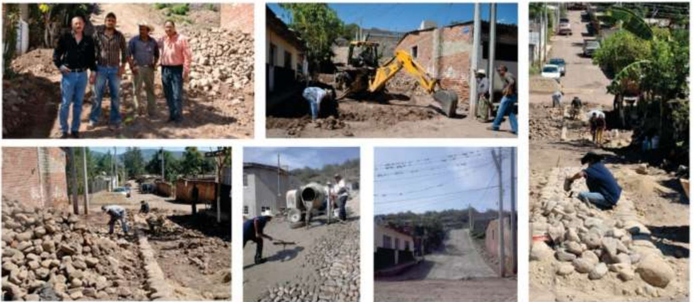
CONSTRUCCIÓN DE EMPEDRADO BAÑADO EN CEMENTO EN LA LOCALIDAD DE SANTA FÉ MONTO DE INVERSIÓN: $ 50,000.00