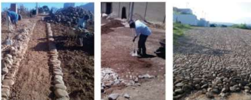
CONSTRUCCIÓN DE EMPEDRADO COMÚN EN CALLE ITALIA, COLONIA LA MARTINICA EN CABECERA MUNICIPAL