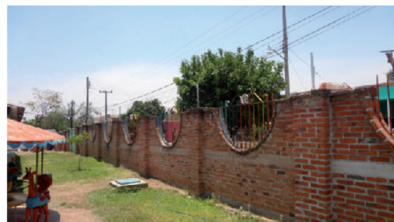
Instalación de malla perimetral en jardín de niños Miguel Andalón