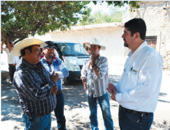
Localidad de Atemanica.