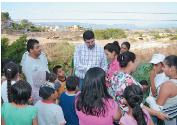
Colonia Chula Vista, Cabecera Municipal.