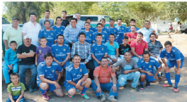
Uniforme deportivo, equipo de fútbol "Mayahuel".