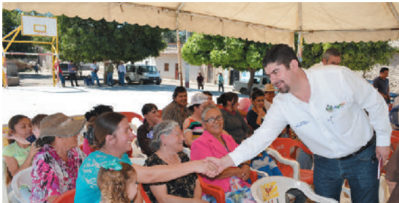
Localidad de El Salvador.