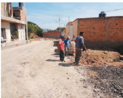
Calle Girasol (antes)

Continuamos con la ejecución de obras de calidad y llevamos a cabo la colocación de 1,059 metros cuadrados de empedrado ahogado en concreto en las calles Girasol y Loma Arbolada en las colonias Guamuchil y Lomas del Paraíso beneficiando a 600 habitantes.