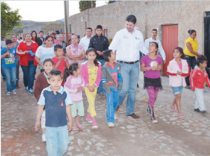
Calle Cerro azul

En la cabecera municipal realizamos obras de empedrado en las calles Gaviota, Chulavista, Lomas del Sabino, Evelia Castañeda (Camino a Los Colgados), camino al rastro municipal, Cerro Azul, Miel de Agave, Belisario Domínguez y José Clemente Orozco de la colonia Josefa Ortiz de Domínguez, con un total de 7 mil 752 metros cuadrados beneficiando aproximadamente a 2 mil 400 tequilenses.