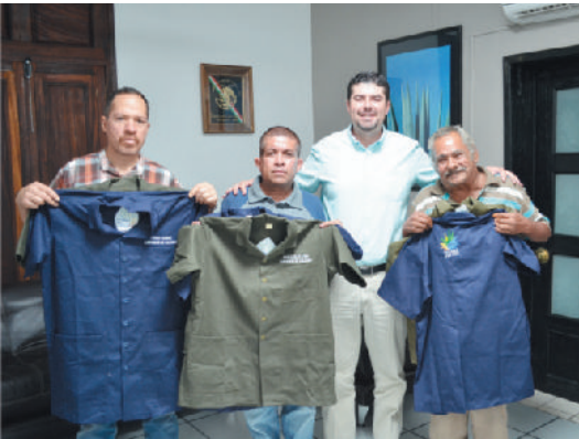
Entrega de camisas de trabajo a boleros.