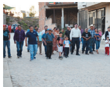
Inauguración calle Girasol (después)