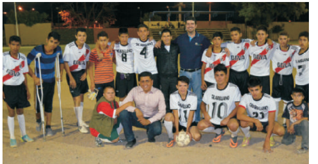
Uniforme deportivo, equipo de fútbol "Santos FC"