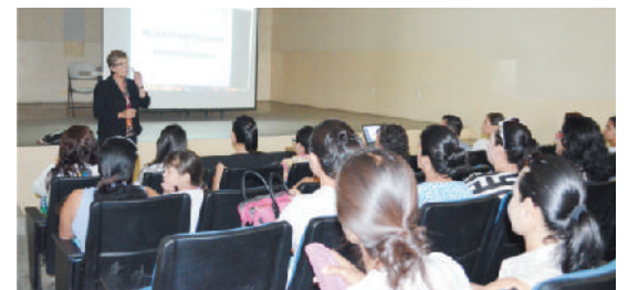
Curso “Mujeres empresarias y emprendedoras”

Jornadas laborales en conjunto con la Unidad de Atención a Víctimas de Violencia Intrafamiliar (UAVI), Comisión Estatal de Derechos Humanos Jalisco delegación Tequila y el Ministerio Público con la plática “La familia y sus valores” en colonias de la cabecera municipal y comunidades como El Salvador, Santa Teresa y Tapexco.