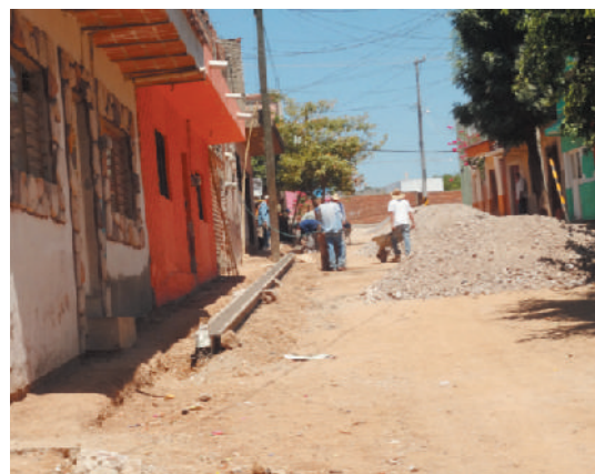
Calle Valentín Gómez Farías