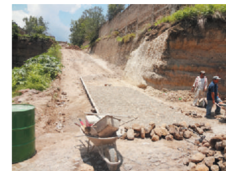
Calle Arbolada (antes)