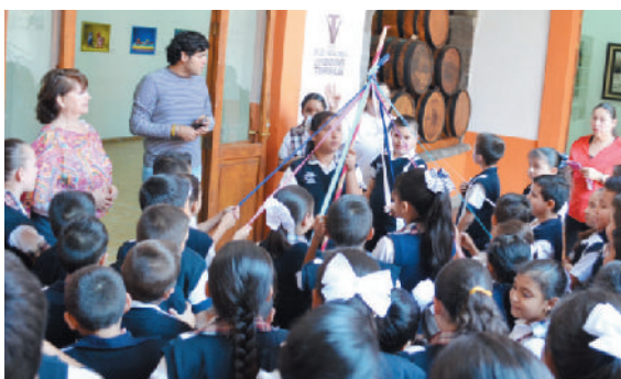
Llevamos a cabo la primera exposición de Arte abstracto con temas que dan cuenta de la historia y cultura del tequila.