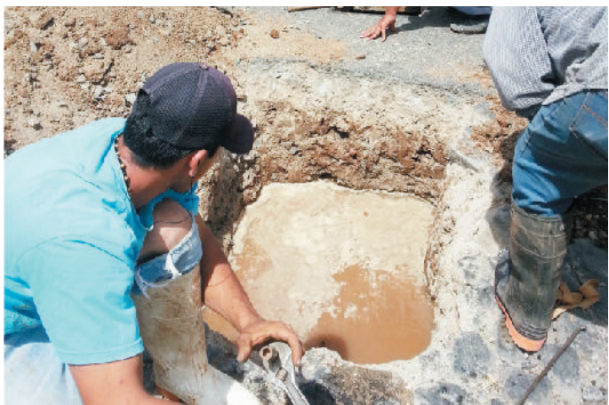
Trabajos de reparación en la calle Toluca