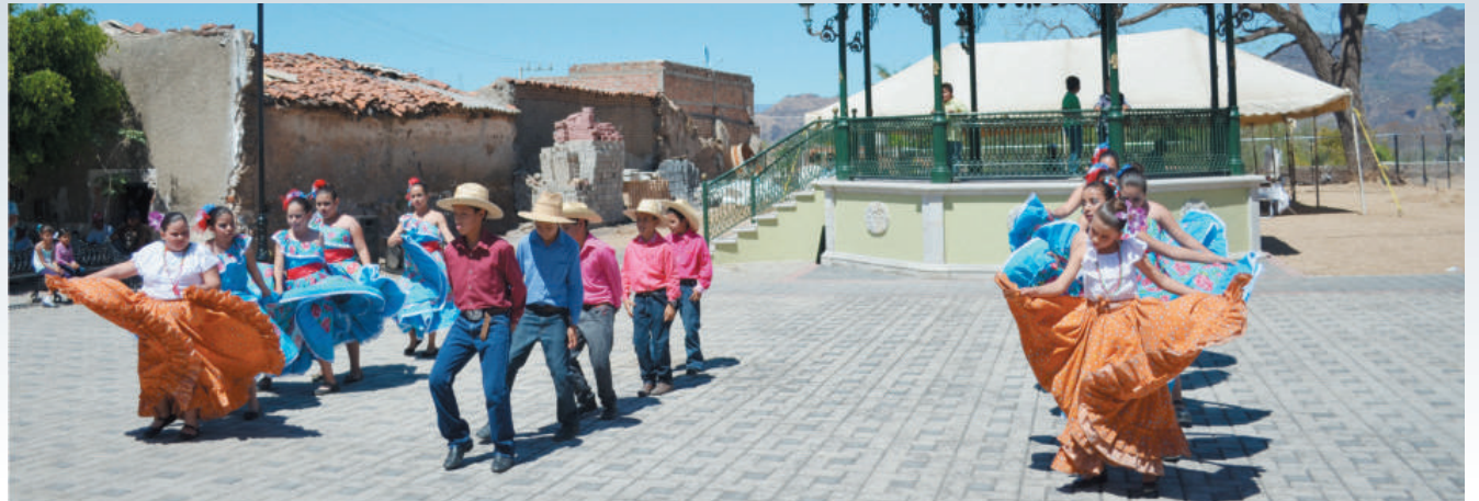
Implementamos talleres artísticos en las comunidades de San Martín y El Salvador.

Llevamos a cabo la remodelación en todas las salas del museo, hoy tenemos más obras, pinturas, fotografías y botellas históricas con record Guinness.