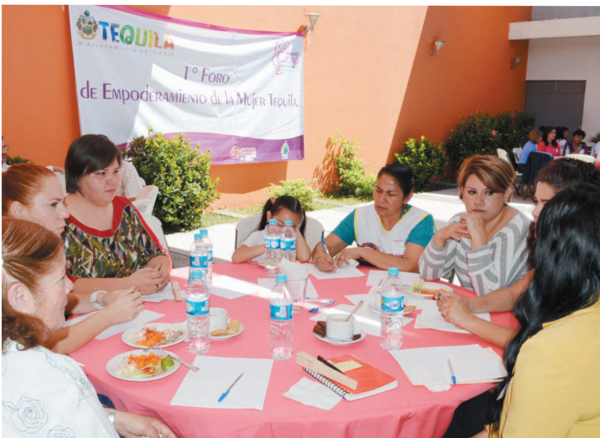
Primer foro “Empoderamiento de la mujer”

Jornadas laborales en conjunto con la Unidad de Atención a Víctimas de Violencia Intrafamiliar (UAVI), Comisión Estatal de Derechos Humanos Jalisco delegación Tequila y el Ministerio Público con la plática “La familia y sus valores” en colonias de la cabecera municipal y comunidades como El Salvador, Santa Teresa y Tapexco.