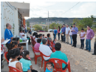
Calle Miel de agave