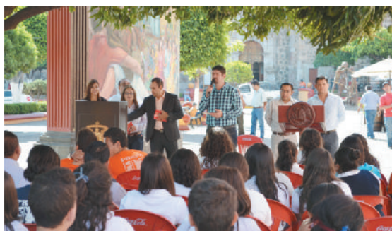
Maratón de lectura conmemorando el día internacional de la lectura

Recibimos a delegados nacionales del CONAFE provenientes de diferentes estados del país, con el propósito de gestionar apoyos para las escuelas rurales de nuestro municipio.