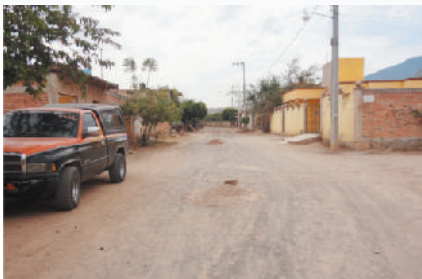
Calle Jimador (antes)