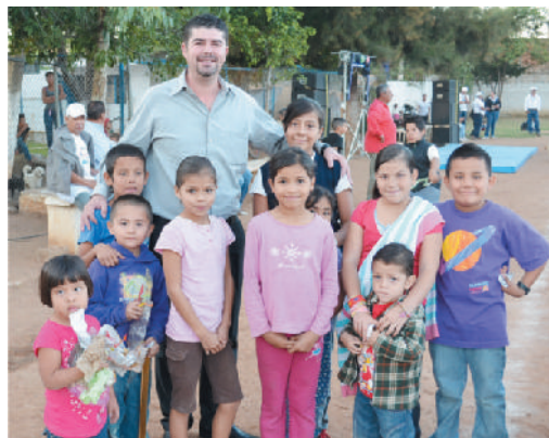
Colonia El Texcalame, Cabecera Municipal.