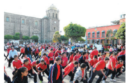
Clase de Zumba para alumnos de diferentes planteles educativos.