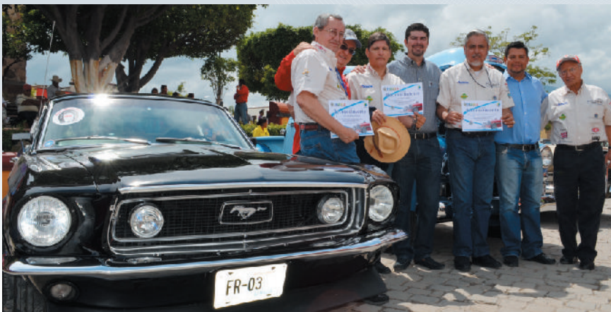
Tuvimos la exposición de 160 carros clásicos en la plaza principal de Tequila.

Con el fin de incrementar la promoción turística de Tequila Pueblo Mágico, sostuvimos una reunión en la oficina de relaciones internacionales en dicha ciudad con la Consul de la embajada de México, la Directora de asuntos internacionales y el Director de Turismo de San Antonio Texas, establecimos acuerdos para promover nuestro Pueblo Mágico en la Semana de Jalisco en San Antonio.