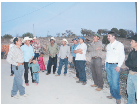
Inauguración de una calle en la localidad El Olvido