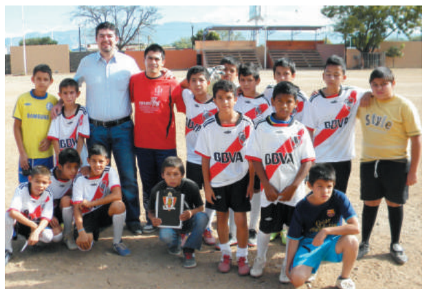
Uniformes deportivos, equipo de fútbol "Novatos".