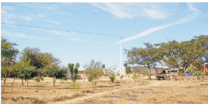
Localidad de El Tepetate

Con la convicción de que en Tequila todas las familias vivan mejor llevamos a cabo 3 electrificaciones más en las colonia Mayahuel y las localidades de El Tepetate y San Ildefonso beneficiando a 780 habitantes que después de años de solicitarlo por fin cuentan con energía eléctrica.