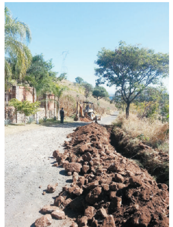
Red de agua potable en la colonia El Texcalame. Red de agua potable en la localidad La Culebra.