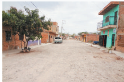
Calle Jimador (después)