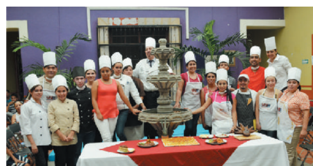
1er diplomado "Arte culinario de alimentos y bebidas"