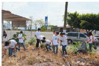
Colonia El Texcalame