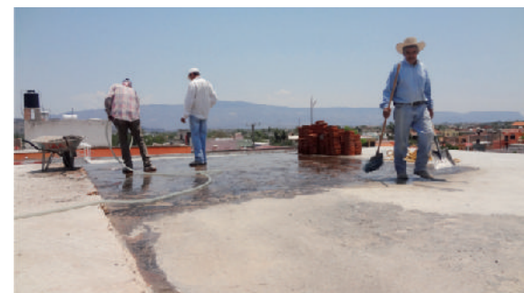
Colocación de tableta y mantenimiento general en Escuela María del Carmen Sauza Mora