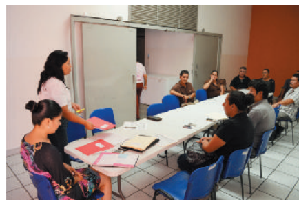
Comité de la Contraloría Social del programa Comunidades saludables.