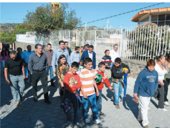
Calle Juan Ramón Castañeda Estrella

También efectuamos importantes obras de adoquinamiento en las calles Juan Ramón Castañeda Estrella, Valentín Gómez Farías y Jesús Iñiguez con un total de 1,713 metros cuadrados beneficiando a más de 1,000 habitantes.