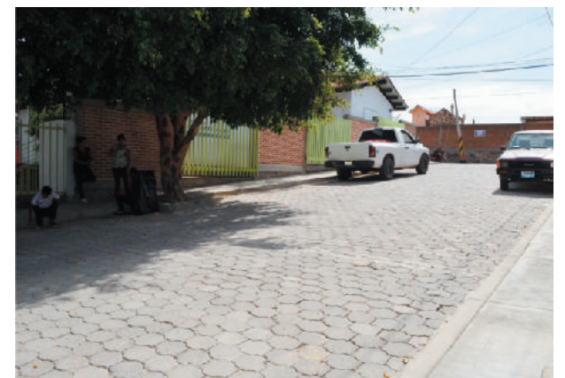
Calle Jesús Iñiguez

“De esta forma continuamos cumpliendo con los compromisos de campaña, trabajando junto con la ciudadanía que demuestra confianza hacia sus autoridades”