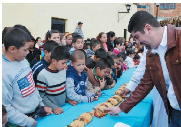
Corte de la rosca de los Santos reyes.