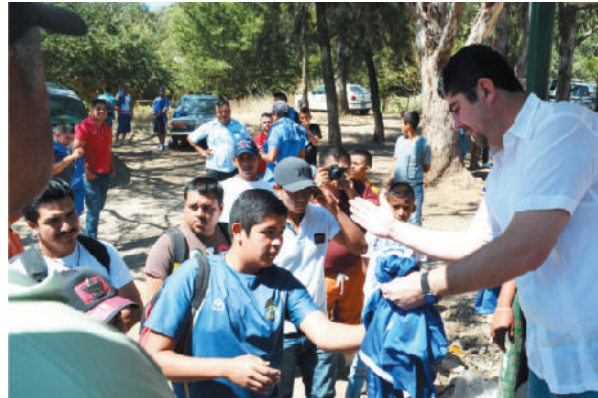
Uniforme deportivo, equipo de fútbol "Mayahuel".