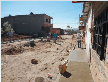
Calle Mayahuel (antes)

Buscando los equilibrios sociales efectuamos importantes obras de empedrado en las calles Jimador y Mayahuel ambas ubicadas en la Colonia Mayahuel con un total de 4 mil 803 metros cuadrados beneficiando directamente a 500 habitantes.