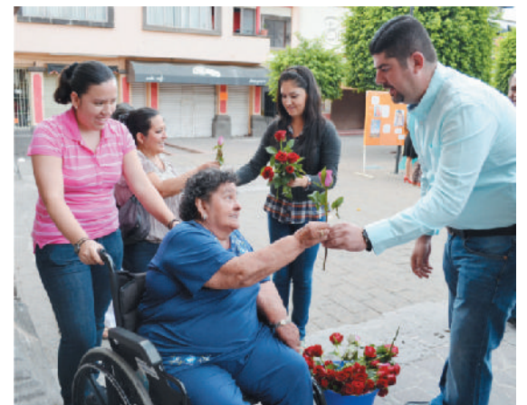
Día de las madres.