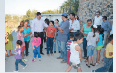
Calle Evelia Castañeda