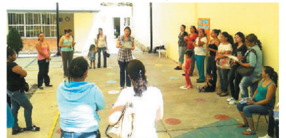
Pláticas “La Familia y sus valores”