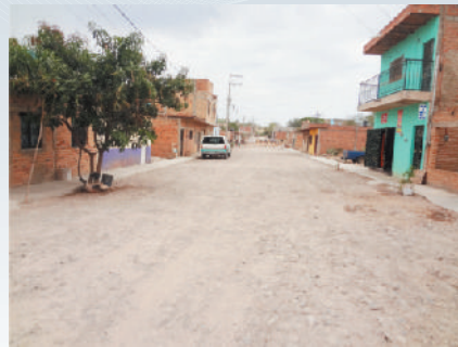
Calle Mayahuel (después)