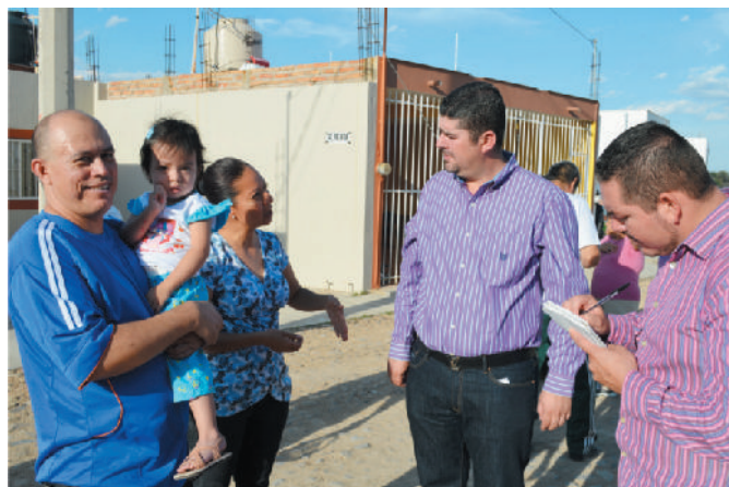
Colonia Paseos de los agaves, Cabecera Municipal.