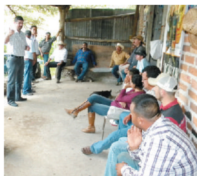
Localidad de San Ildefonso

En estas trascendentes obras se invirtieron: