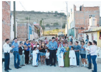
Calle Belisario Domínguez