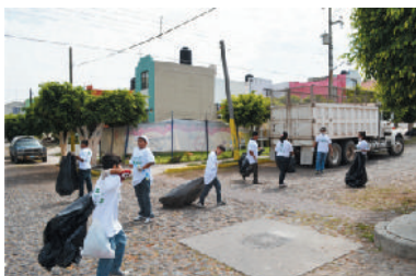
Colonia Infonavit viejo