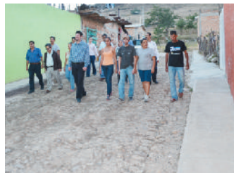
Calle José Clemente Orozco