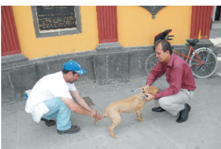
Campaña de vacunación antirrábica canina.