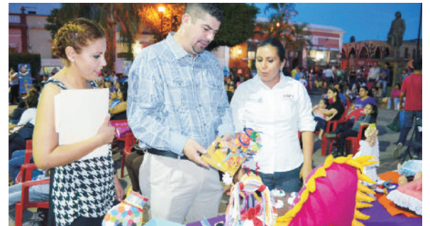
Recibimos el festival cultural “Yos soy Jalisco”