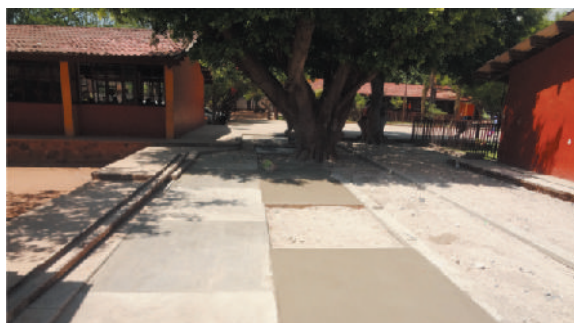
Losa de concreto en Escuela E. Rafael Salazar Alcazar

Como parte de nuestro compromiso con la educación trabajamos de manera activa y eficiente brindando apoyo con mano de obra para mejorar la infraestructura de las escuelas.