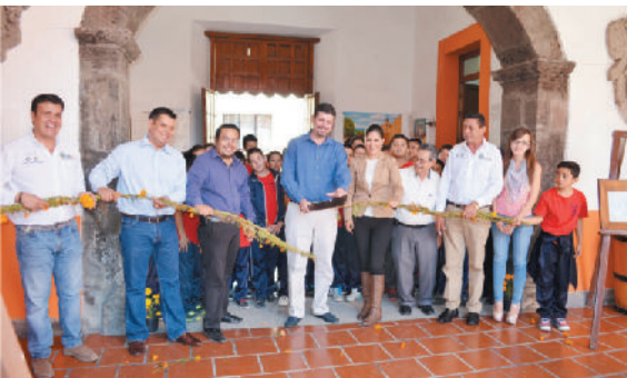
Exposición "Tequila ayer"

Por segundo año continuamos con una intensa temporada de actividades buscando promover las artes y la armonía social. Invitamos cordialmente a la población en general y turismo que nos visita a apreciar diversas exposiciones de arte, obras de teatro y muestras de cine.