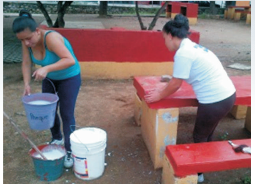
Mantenimiento de áreas verdes en centros educativos y espacios públicos

“Coordinamos y aplicamos recursos humanos y materiales para el mantenimiento integral de áreas verdes. Durante el segundo año continuamos trabajando para seguir proyectando a nuestro Pueblo Mágico como un lugar agradable, limpio, con excelentes áreas verdes de manera que se refleje la magia y la convivencia del municipio”