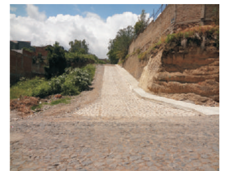
Calle Arbolada (después)

Colocamos 1,310 metros cuadrados en la calle Contreras Medellín ubicada en la localidad de Santa Teresa, beneficiando a 600 habitantes.