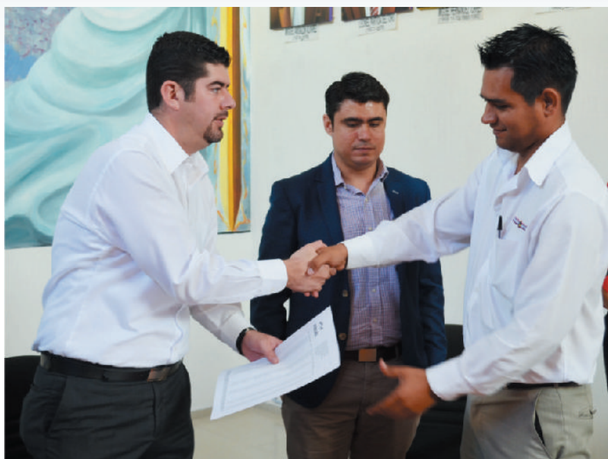
“Seguimos avanzando juntos para contribuir al desarrollo económico del municipio”