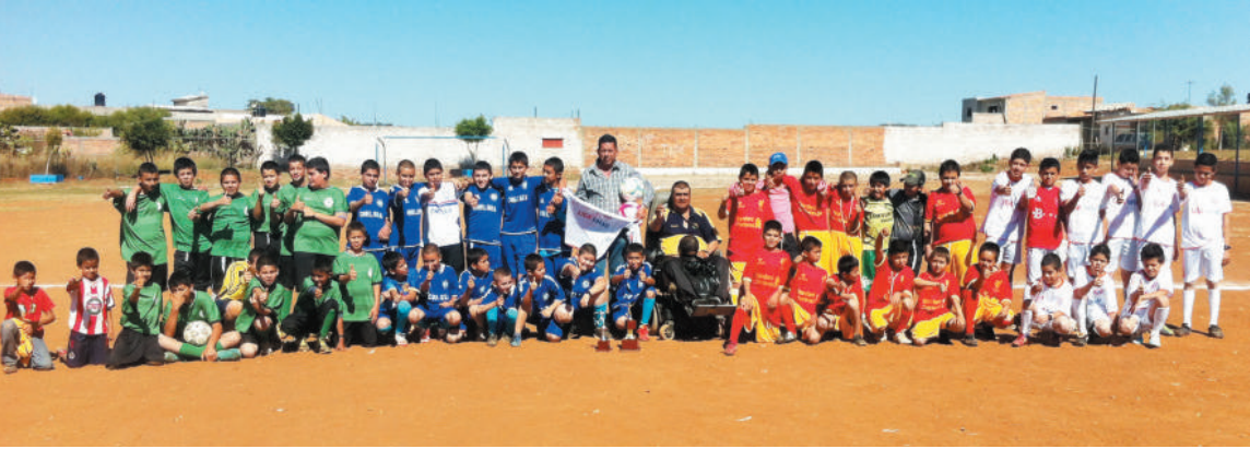
Entrega de uniformes y balones a niños de la localidad de El Salvador.