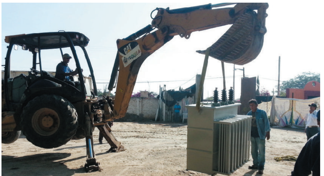
Reparación del transformador del pozo acuífero de El Texcalame.