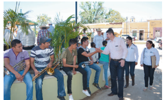
Localidad Santa Teresa.