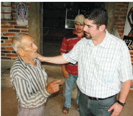
Localidad San Ildelfonso.