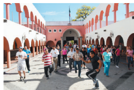
Activación física entre funcionarios y trabajadores del Ayuntamiento.