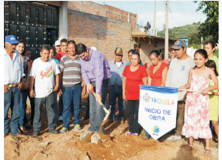
Calle Lomas del Sabino