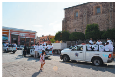
Inicio de campaña