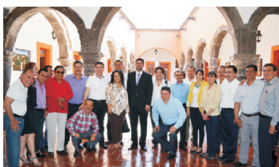
Delegados nacioanles de CONAFE