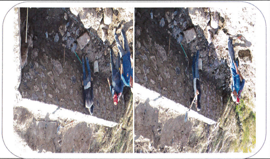
FOTOGRAFÍAS DE LA OBRA