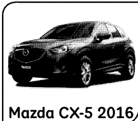
Mazda CX-5 2016

SI INMIERTES A PLAZO A TRAVES DE TU CUENTA UNICA, TENDRAS ACCESO A UNA LINEA DE PROTECCION PARA EMERGENCIAS DE HASTA EL 80% DEL MONTO DE TU INVERSION. PREGUNTA A TU JEFCUTIVO.