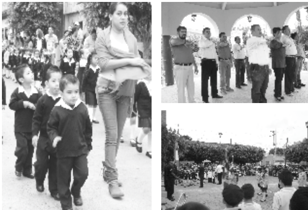
DESFILE CÍVICO EN SANTA CRUZ DEL ASTILLERO