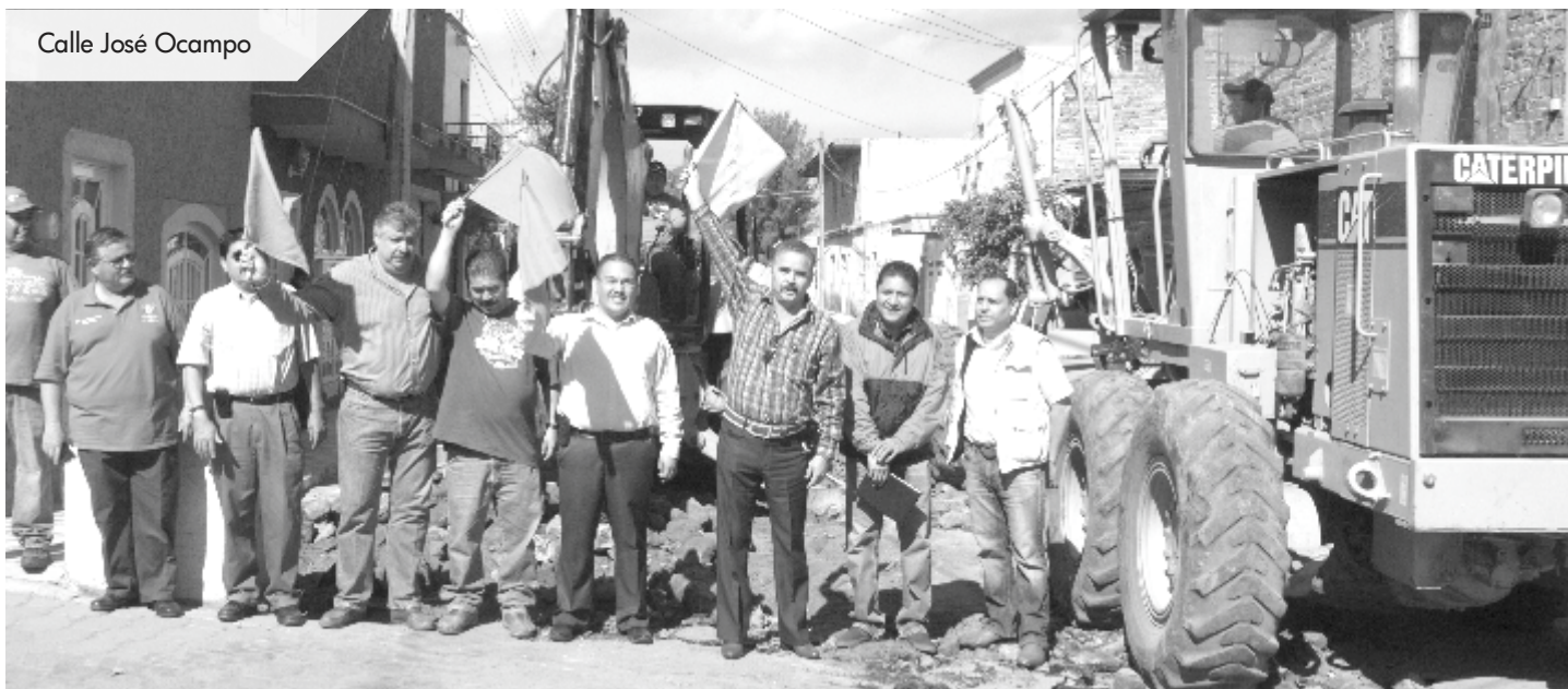
Calle José Ocampo

ARRANCA UNA DE LAS OBRAS MÁS IMPORTANTES DE LA ADMINISTRACIÓN EN LA CABECERA MUNICIPAL.