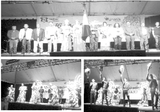
GRITO EN EMILIANO ZAPATA