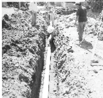
Calle Abasolo, Sta. Cruz

La Dirección de Agua Potable continúa realizando obras en beneficio de la cabecera municipal y sus delegaciones, nuestro compromiso es mejorar el servicio cada día, recuerda que nos puedes apoyar reportando fugas, fallas y denunciando el desperdicio de agua potable.