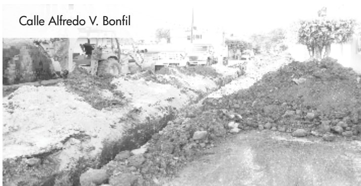
Calle Alfredo V. Bonfil

Así como en la calle Ferrocarril, también en la calle 5 de Mayo trabajamos renovando las redes de Agua Potable y Drenaje Público.