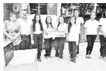
Sec. Foránea # 63 Aquiles Serdán, Santa Cruz del Astillero: Entrega de Material Didáctico.