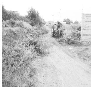
Se realizó una nivelación y limpieza en la calle Jesús García, debido a que anteriormente esta calle se encontraba intransitable.