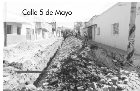
Calle 5 de Mayo

Así como en la calle Ferrocarril, también en la calle 5 de Mayo trabajamos renovando las redes de Agua Potable y Drenaje Público.