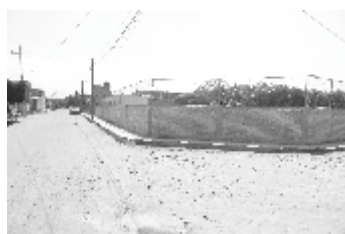
Miguel Hidalgo: Rehabilitación de 50 metros de Barda Perimetral.