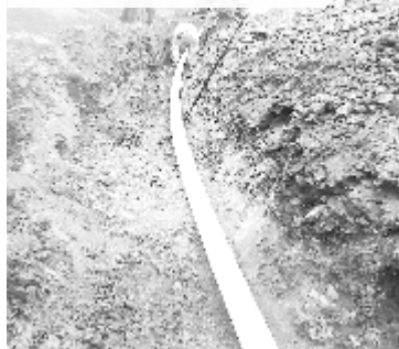
Arboledas: Instalación de 120 metros de tubería de Agua Potable en la calle Arboledas.