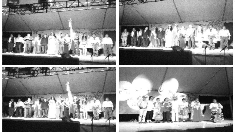
GRITO EN HUAXTLA