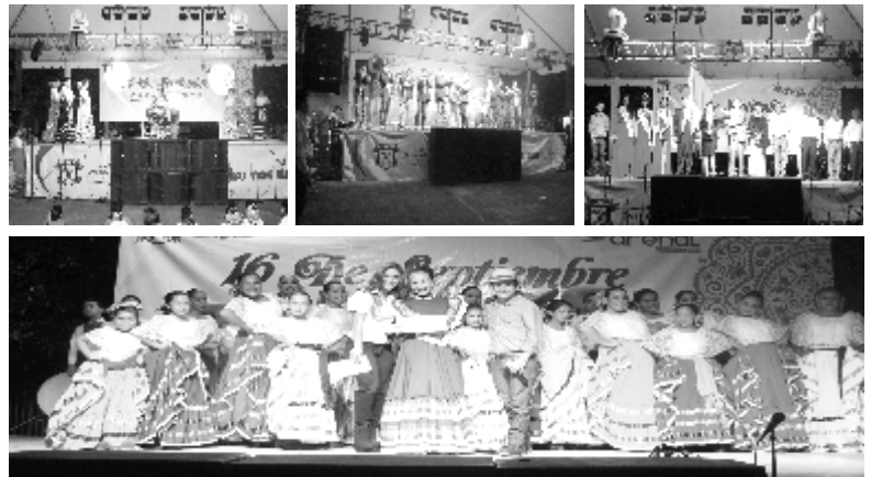
GRITO EN SANTA CRUZ DEL ASTILLERO