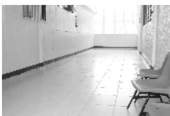
Kinder Jean Piaget: Instalación de Piso anti derrapante.

Con motivo de una importante gestión del Gobierno de El Arenal realizada a través de la Coordinación de Educación Municipal y con el apoyo de "Casa Herradura", se continúa trabajando en beneficio de las instituciones educativas del municipio, en la primera etapa de esta colaboración algunas escuelas de la cabecera municipal se vieron beneficiadas con la remodelación y mantenimiento de las instalaciones.