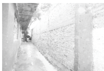
José Clemente Orozco: Rehabilitación de Barda Perimetral.