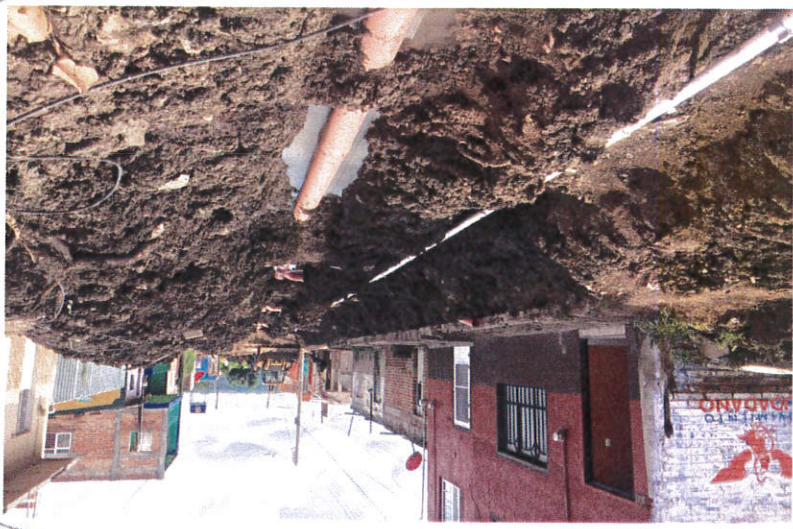
FOTOGRAFÍAS DE LA OBRA