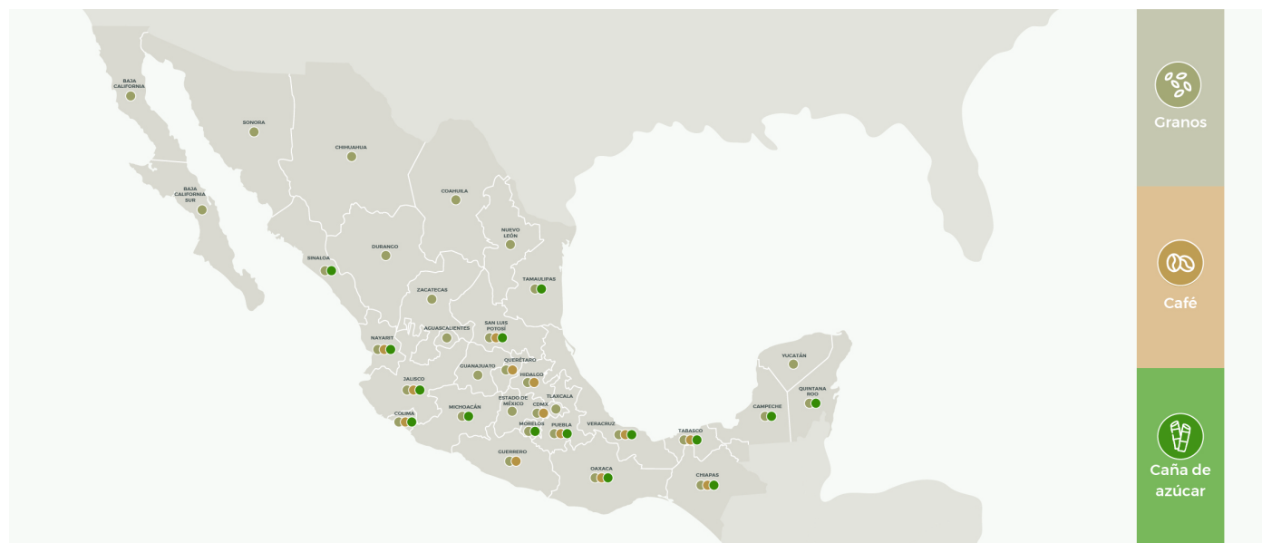
( https://www.gob.mx/cms/uploads/image/file/508080/Infograf_a-granos-b_sico-mapa.jpg )

Incluye a los productores de café que producen en Chiapas, Colima, Guerrero, Hidalgo, Jalisco, México, Nayarit, Oaxaca, Puebla, Querétaro, San Luis Potosí, Tabasco y Veracruz.