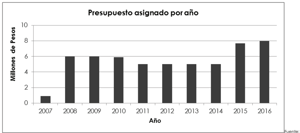
Gráfica 2. Monto anual del presupuesto (en millones de pesos) asignado al programa "Becas Indígenas" (2007), "Becas Indígenas Maestro Carlos Castillo Peraza" (2008-2012) y "Becas Indígenas" 2013-2016

Elaboración propia con datos obtenidos del Periódico Oficial del Estado de Jalisco 2007-2016.