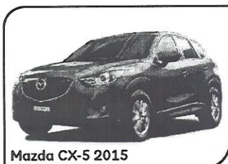
Mazda CX-5 2015

Total de comisiones cobradas en el Periodo: $0.00