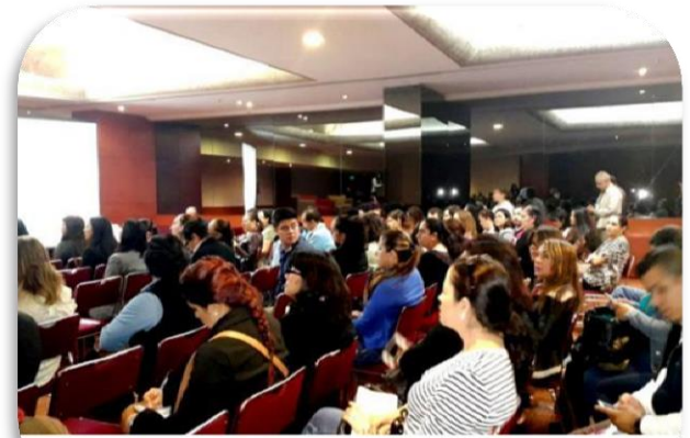
Meta: BII4 Seminario de Prevención de la Violencia contra las Mujeres Tarea de Tod@s. de Noviembre 2015