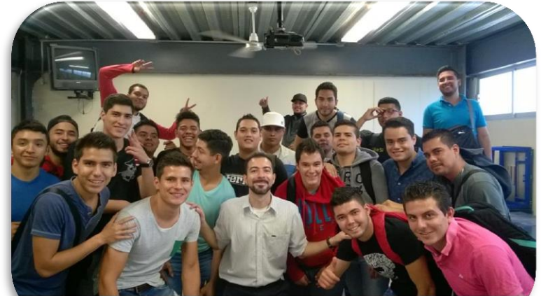
Meta: 19 Proceso de sensibilización para hombres en materia de Violencia Contra las Mujeres, dirigido a 150 estudiantes de nivel superior