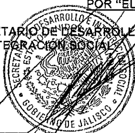
LIC. SALVADOR RIZO CASTELO

EL SECRETARIO DE DESARROLLO E INTEGRACIÓN SOCIAL